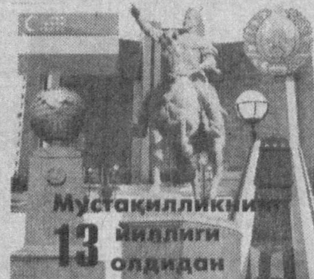
Мустақилликнинг 13 йиллиги олдидан

«Сарбонтекс», «Момик-СВ» каби корхоналарнинг издоши «Камфармтекс», «Сай-хунмедтекс», «Сесли» каби янги ишлаб чиқариш корхоналари иш бошлаш арафасида. Эътиборли жиҳати тadbиркорлар сай-ҳаракати уларқор қишлоқларда ҳам ихчам корхоналар иш бошлапти. Улар ҳудуд аҳолисини иш билан таъминлашга муносиб улуш қўйиш билан бир пайтада экспорт ҳажмини ошира бораётгани эътиборга моликдир.