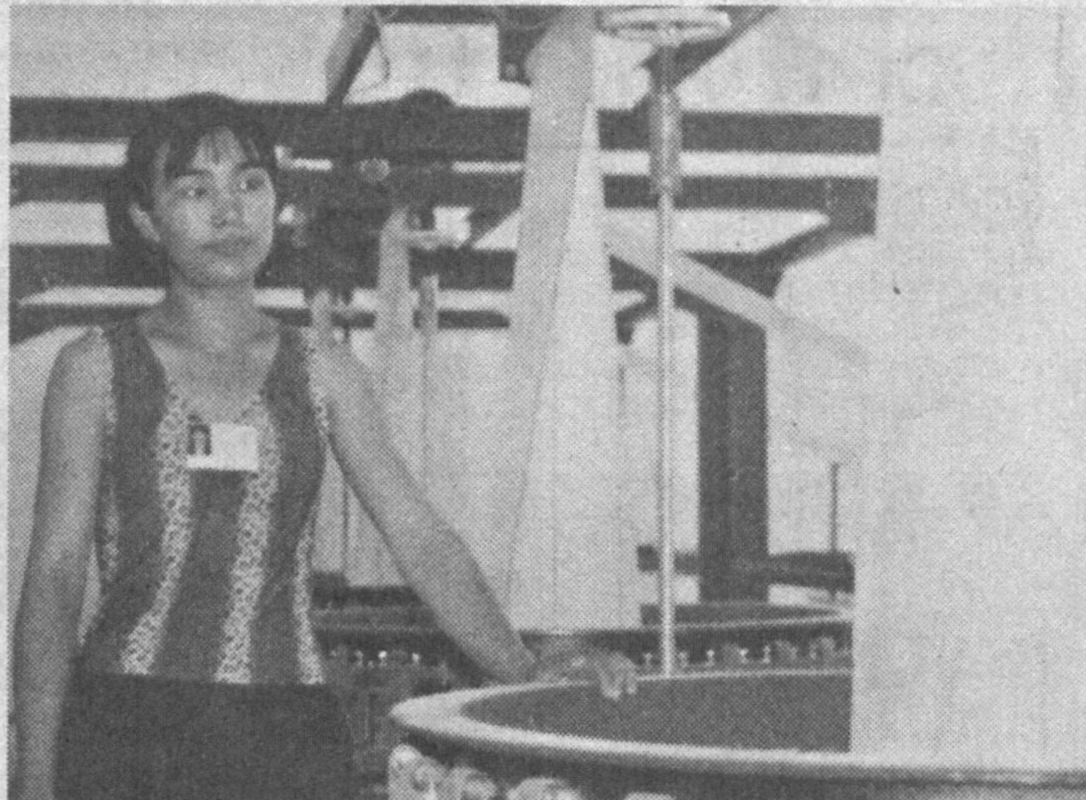
«Pekin-Chirchiq LTD» кўшма корхонаси ўтган йили хитойлик ишбилармонлар билан ҳамкорликда ташкил этилган бўлиб, хозирги вақтда бу ерда 150 нафар ишчи меҳнат қилмоқда.