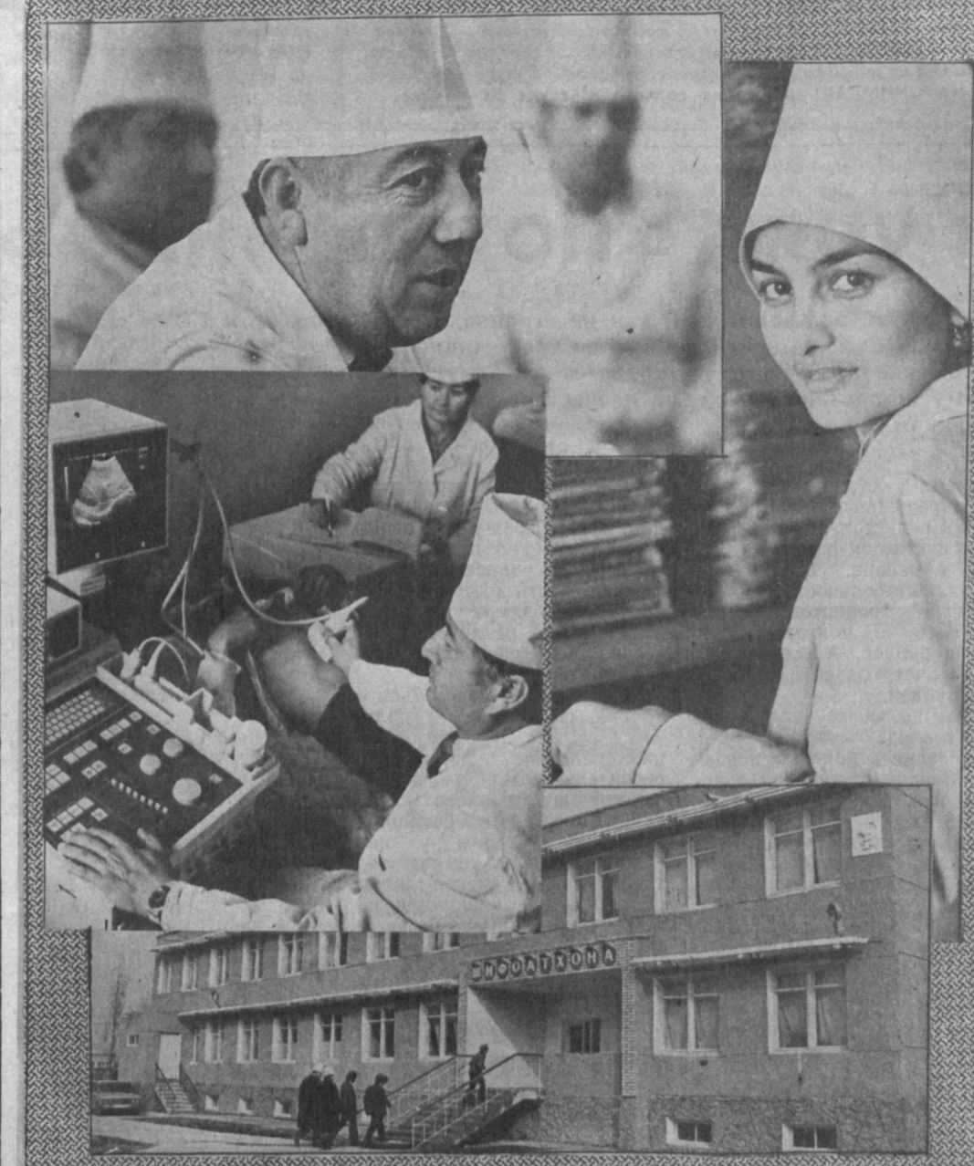
Новая поликлиника на 300 посещений в день открылась в центре Ташкентского района. Квалифицированную медицинскую помощь сейчас оказывают 26 специалистов. Здесь можно получить ультразвуковое, кардиологическое обследование. Работают кабинеты рентгенологии и лазерного лечения. Для оборудования поликлиники закуплено японской аппаратуры общей стоимостью

Для фабрики самое страшное сейчас не потеря престижа и прибыли, а отток квалифицированных кадров. На ней трудятся люди редких профессий, на подготовку которых уходят годы. Поэтому здесь стремятся любыми путями удержать специалистов, сохранить коллектив.