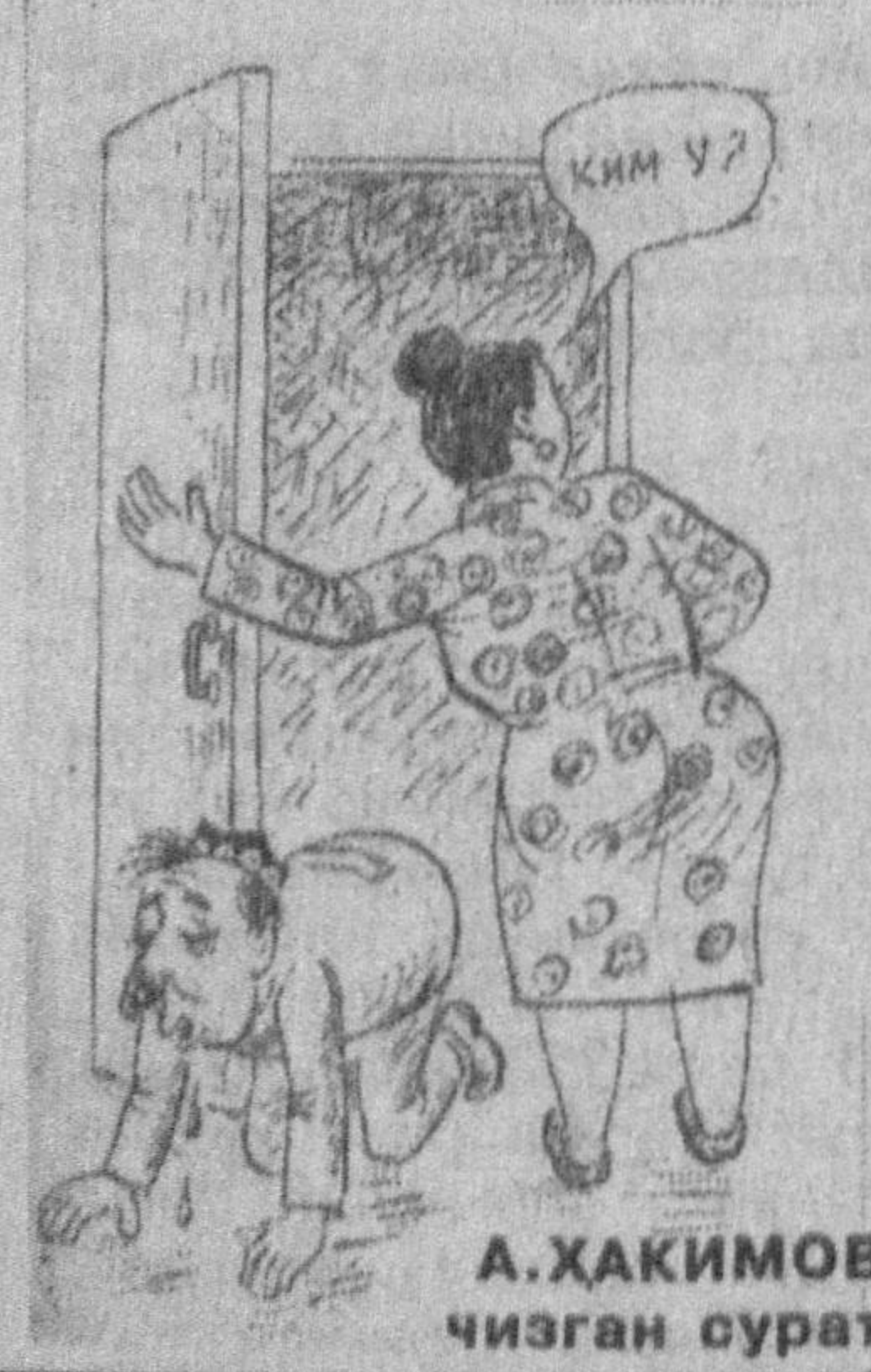
А.ҲАКИМОВ чизган сурат