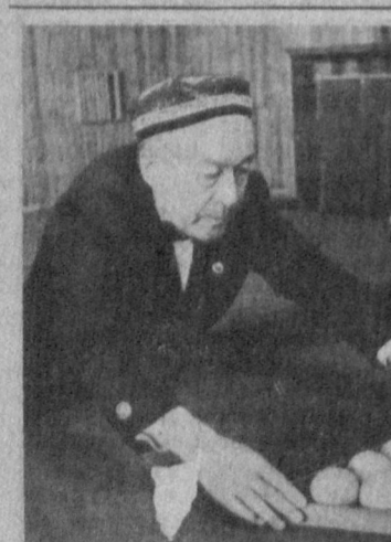
Второй чемпионат республики по бильярду состоялся в Самарканде. В нем приняли участие 24 спортсмена из Ташкента, Самарканда, Ташкентской и Кашкарданской областей.