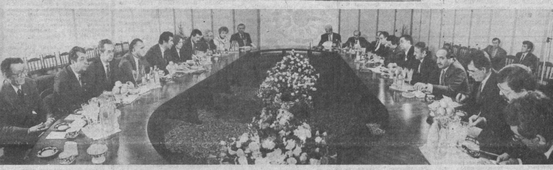
Председатель Верховного Совета Республики Узбекистан Ш. М. Юлдашев принял парламентскую делегацию Турции.

Депутат Великого национального собрания Турции Нохит Ментеша поздравил Президента и узбекский народ с принятием в члены ООН. Нет сомнения, сказал он, что Узбекистан в ближайшем будущем станет процветающим краем. Он также отметил важность дальнейшего развития сотрудничества парламента двух стран.