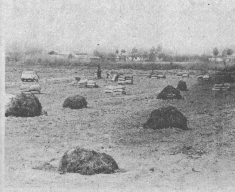
СУРХАНДАРЬИНСКАЯ ОБЛАСТЬ. Колхоз «Дустлик» Термезского района заключил договор с представителями городов России — в обмен на овощи получить дизельное топливо и лес. До февраля на Дальний Восток и в Якутию отравили 390 тонн сельхозпродукции. А теперь с увеличением госпошлин и 30-процентным налогом ситуация изменилась не в пользу колхозников — слишком дорого обходится дефицитное топливо. Однако весной торопит: сев на носу, а техника обеспечена горючим лишь на 30 процентов. На полях лежат груды моркови, свеклы, репы — всего свыше 400 тонн продукции...