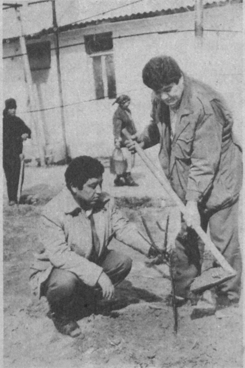
В это время года широко идет подготовительная работа для выращивания богатых урожаев на полях нашей республики. Не покладая рук трудятся сейчас земледельцы Джизакской области.

Н. АБДУЛЛАЕВ, Сок. корр. «Правды Востока», Наманганский район.