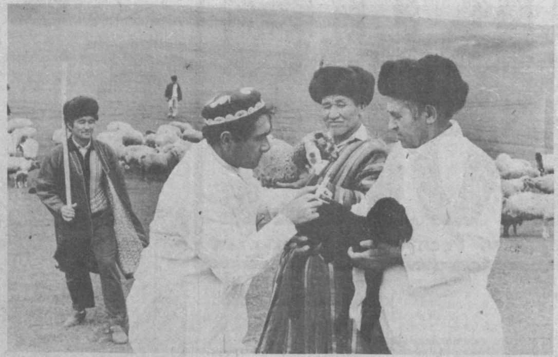
КАШКАДАРЬСКАЯ ОБЛАСТЬ. Расплодную кампания началась в отарах госплемзавода «Гузар» Гузарского района. Вместе с чабанами здесь ведут селекционную работу сотрудники Каршинского филиала республиканского научно-исследовательского института каракулеводства. Производятся бонитировка агнят, учет продуктивных овец, от которых будут отправлены за рубеж. В отарах хозяйства содержится свыше 44 тысяч голов, больше половины из них — овцематки. От