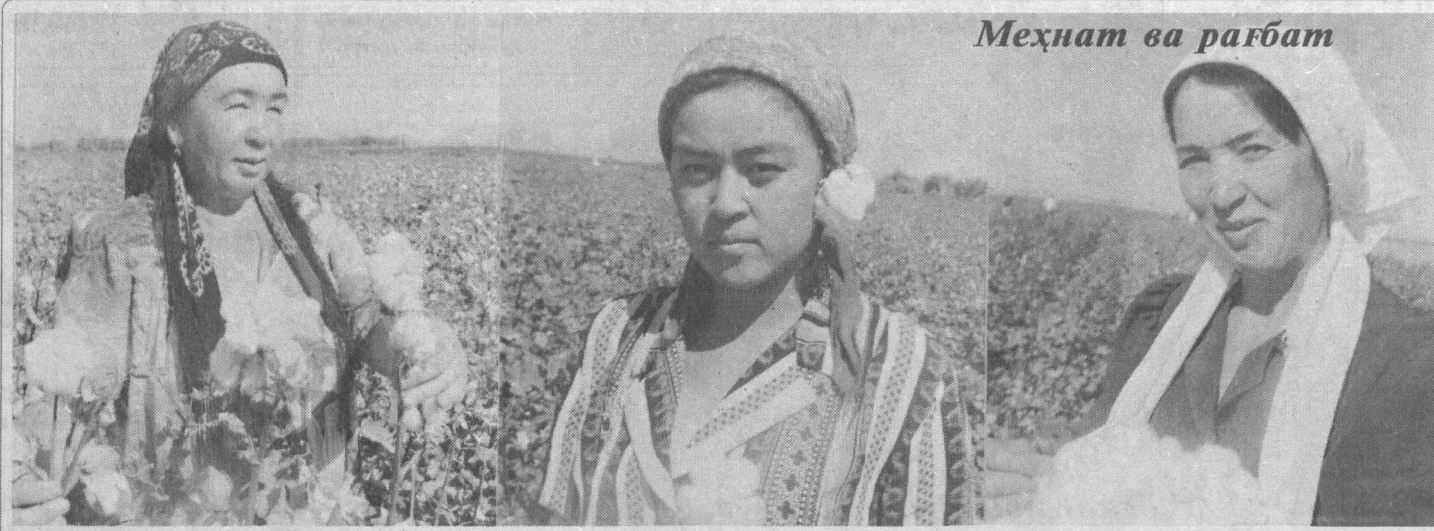
Меҳнат ва рағбат