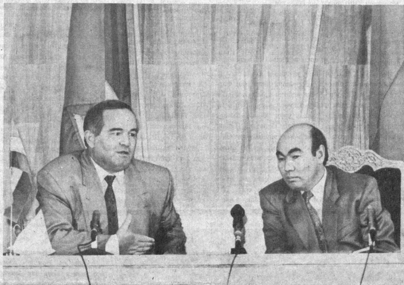
СУРАТДА: матбуот конференцияси пайти.

Асқар Акаев Ўзбекистон Республикасининг Президенти Ислам Каримов билан учрашди. Сўхбат чоғида Қирғизистон ўз валютасига ўтиши натижасида иқтисодий муносабатларда вужудга келган муаммолар муҳокама қилинди. Давлат бошчилигидаги республика аҳолиси қўлидаги рублларни тезроқ қайтариб олиш, бу пуллар Ўзбекистонга ўтишига йўл қўйишнинг воситаларини муҳокама қилинди.