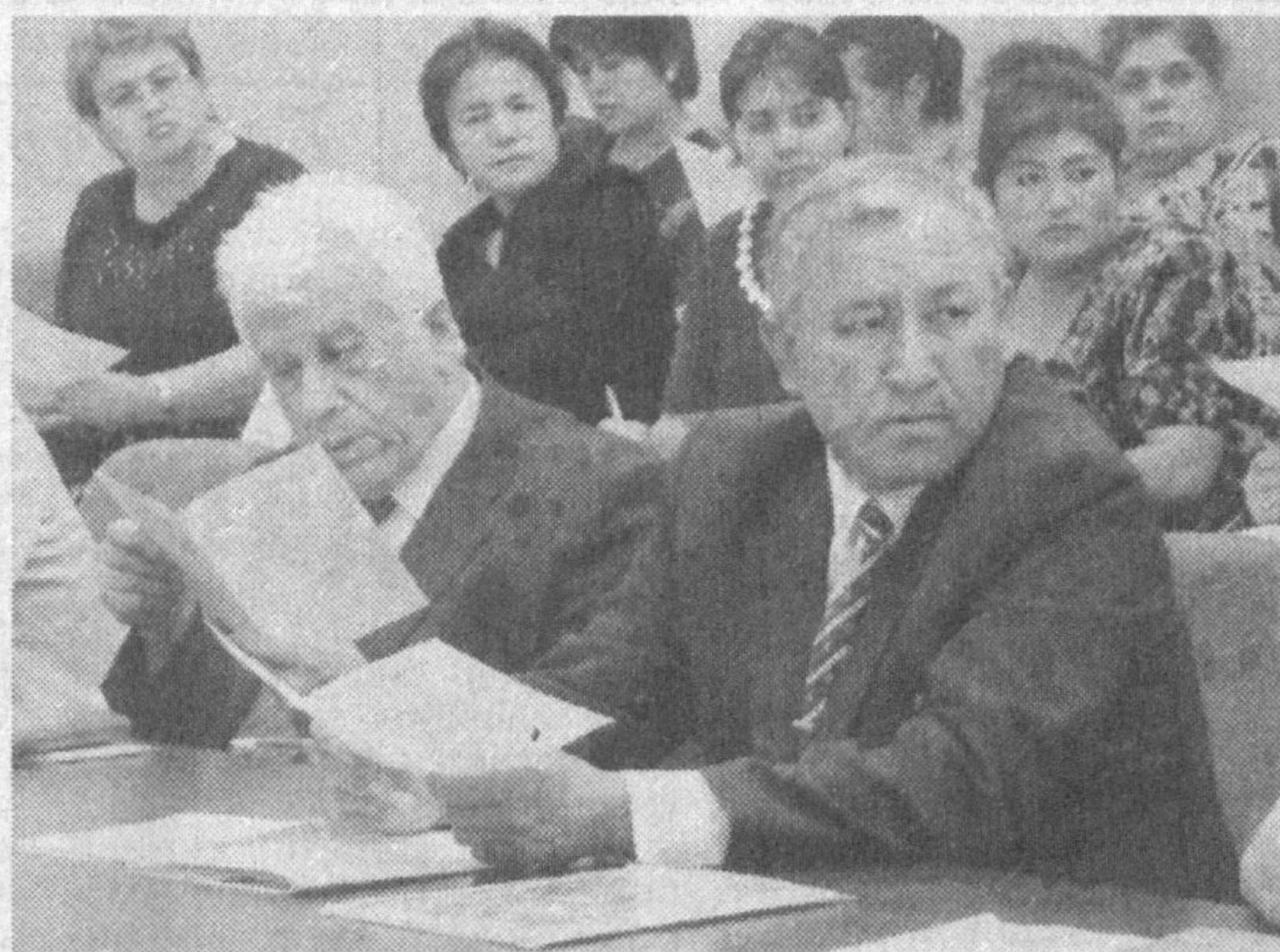
Ўзбекистон таълим ва фан ходимлари касаба уюшма Марказий қўмитасининг ҳар бир йиғилишида соҳа мутасаддилари олдига турган энг долзарб масалалар ишчанлик, ўзаро таллабчанлик вазиятида атрофлича муҳо-