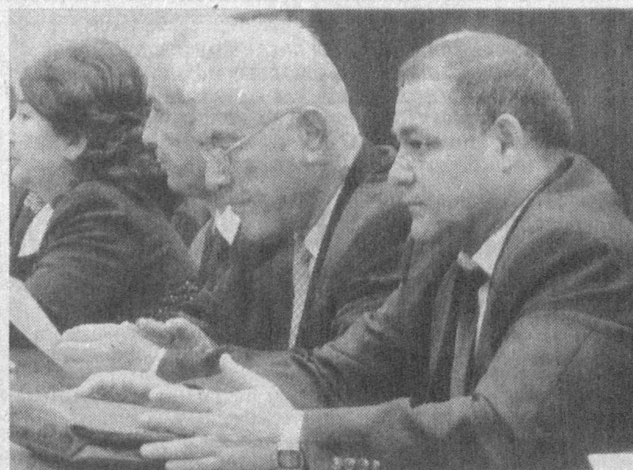
мама этилади. Илғорлар тажрибасини аммаллаштириш, давр ўртага қўйётган талаблар асосида иш юритиш юзасидан аниқ тадбирлар ишлаб чиқилди. Қуни кеча бўлиб ўтган Пленум иштирокчилари эса Ўзбекистон таълим ва