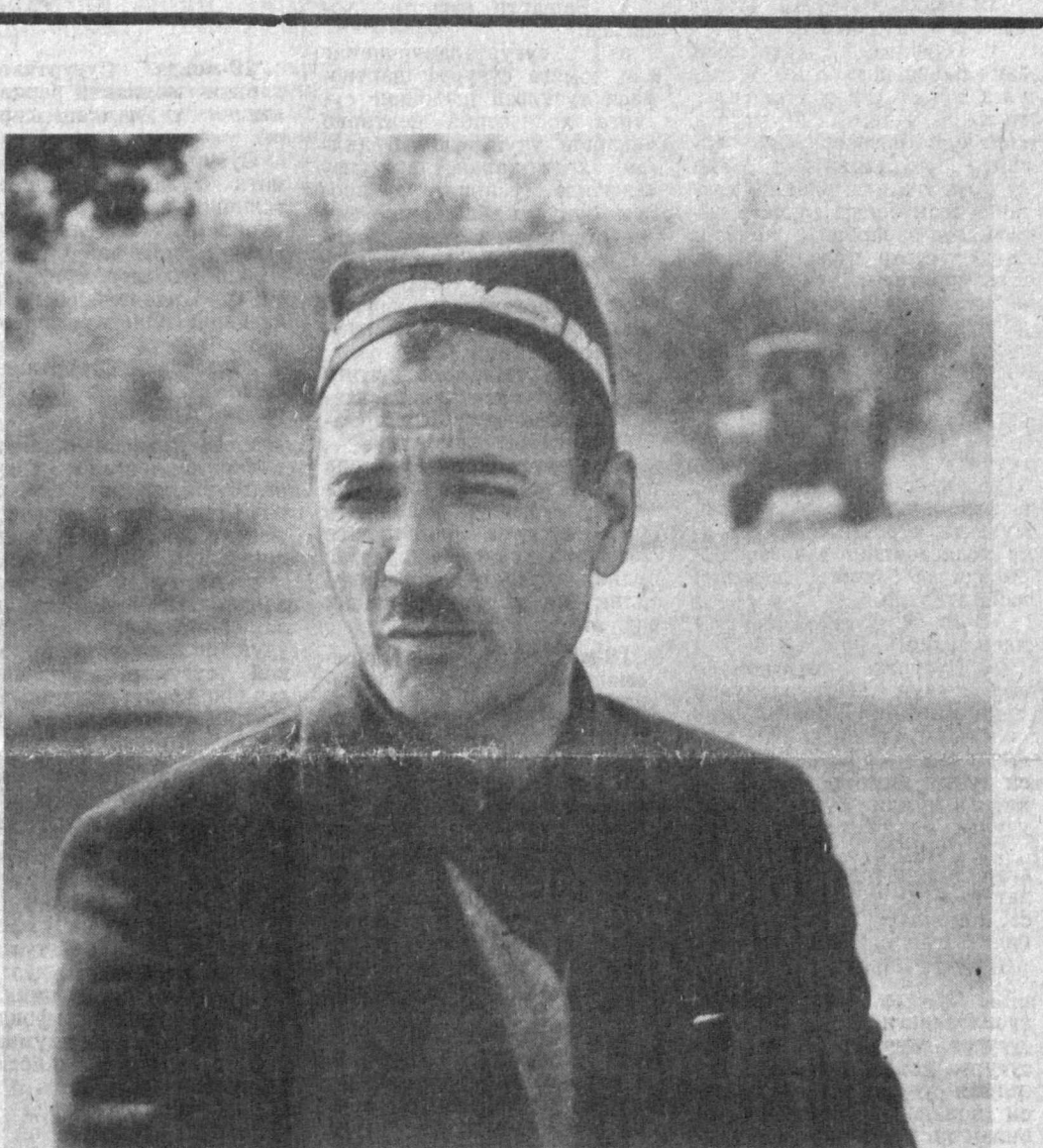
Андижон вилоятининг Марҳамат туманидаги Охунбобоев номи давлат наслилик хўжалиги нафақат зотли чорва моллари етиштириш бўйича, балки кичик корхоналарнинг қўлги жиҳатидан ҳам етакчи ўрнида туради. Аяни пайтада хўжаликда рўмол тўқиш, дуррадорлик, оҳак, асфальт, тегирмаон, мойжуво ва шунга ўхшаш бир қатор