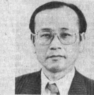
1943 йилда Хитойда туғилган. 1966 йилда Токио дорилфу-

нунининг ҳуқуқшунослик факультетини битирган. 1966 йилда Япония Ташқи ишлар вазириликка ишга кирган. 1966 йилда Англиядаги ҳарбий мактабда ўқиган. 1967 йилда Лондон дорилфунунининг Шарқий Европа факультетини битирган. 1968 йилда Москва Давлат дорилфунуни институтининг факультетини битирган. 1969—70 йилларда Япониянинг Москвадаги элчихонаси котиби бўлиб ишлаган. 1971 йилдан — Япония Ташқи ишлар вазирилик халқаро