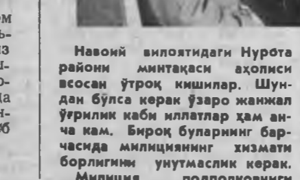
Навоий вилоятидаги Мурота райони миктабаси аҳолиси вевосан ўтроқ қилишлар. Шундан бўлса керак ўзаро жанжал ўрилик каби иллатлар ҳам анча кам. Биринчи бўлиб барқасида миллияни хизмати борлигини унутмаслик керак. Миллиция подполковниги