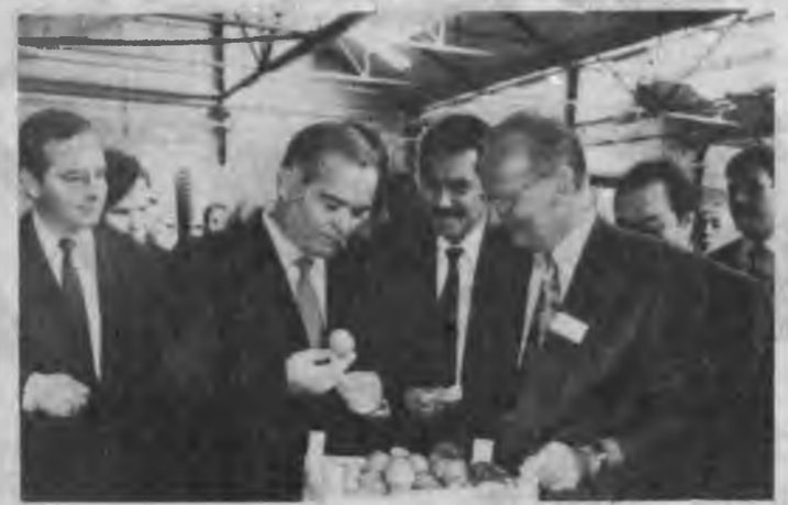
Дарёе, Президент Исом Каримовнинг зиярати ҳам расий-амалий деган унвома эди. Амалий ёнари...

қайтиб, ўз Советлар юртидан афзаллини кўрмадик, деб савфата сотар эдилар. Энди билсак, дунёда гап кўп акан. Шу қадар кўлики, ҳайратиниз ҳам етмай қолар.