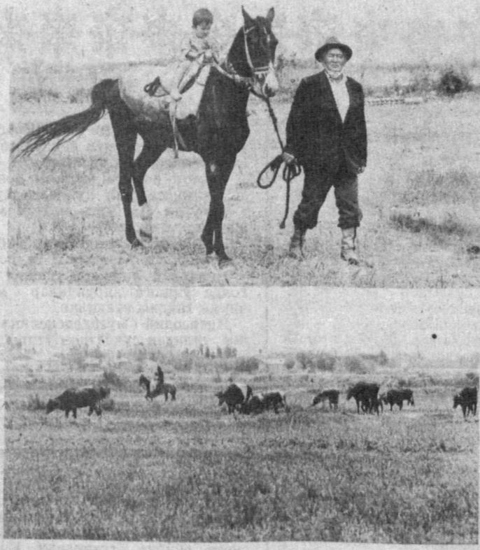
Хўжайли туманидаги Йўлдош Озунбобоев номли жамоа аъзалари фермерлар ҳақида гап кетганда Илбас ана Байрам хўраб билан тилга олди. У шундан сўнг йўлдош Озунбобоевнинг «Суратлар»: фермер Илбас Байрам наваралари билан далда.