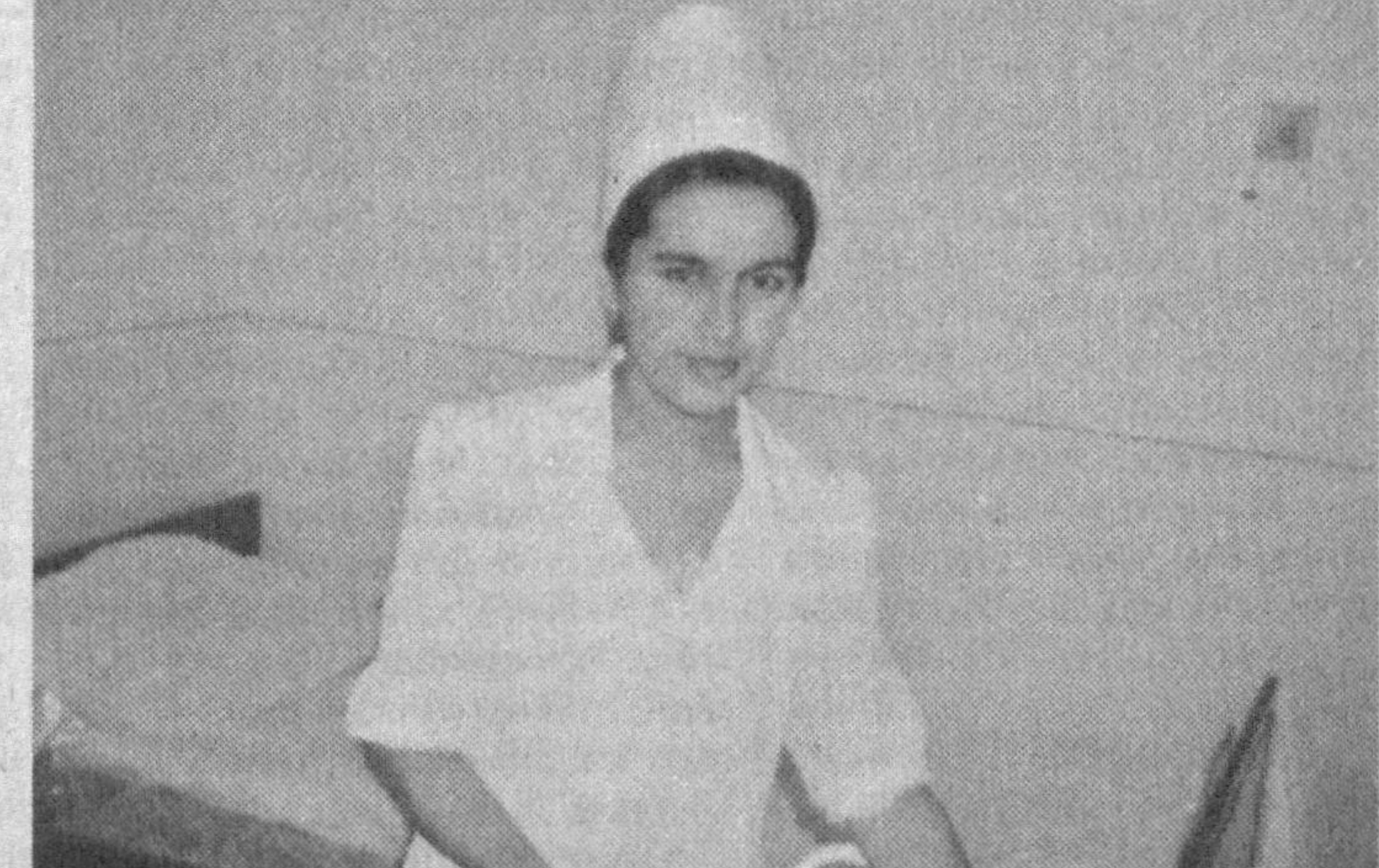
Суратларда: хўсўсий шифохона ҳаётдан лавҳалар.