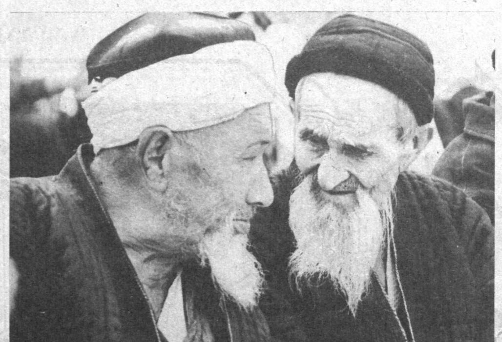
— Э. У. КУНЛАР ҲТДИ...

ман ва яна бир-икки шеър ўқира эдим. Меннинг завқим ва маъносилигини томоша қиладиган киши йўқ. Ёшиқ, ширин, эзгу туйғулар. Бехиштиғи дунё оғушига нафтада олиб чиқиб, гўзаллик ва бахтиёрлик тожини кийдиради.