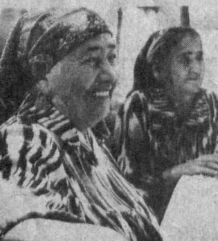
Худога шукрларким, «саодат» хонинг хонадонини гав- жум. Унда 5—6 ва унданда кўп журналхонлар бор.

Шуни ҳисобга олсак, ўқув- чиларини сонидан нолима- сак, ижодимиз маҳсулидан қониқсан бўладигандек. Лекин ижодкор аҳли бори, бундан қаноатланмайди, яна- ла кўпроқ мушаррифлари билан мулоқотда бўлгани кела- ди. Ана шу иштиёқ «Саодат» ижодкорларини Тошкент ви- лоти Сангиота туманининг Сангиота номи жамоа хў- жалигига бошлади.