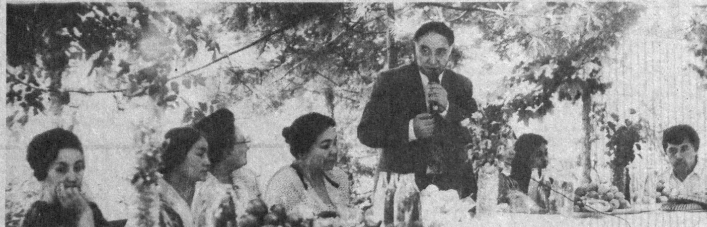
«САОДАТ» журнали ўз ўқувчилари сонини жиҳатидан республикада энг юқори ўринларда турайдиган нашрлардан биридир. «Саодат» ҳозир 300 мингга яқин хонадонга кириб бормоқда.