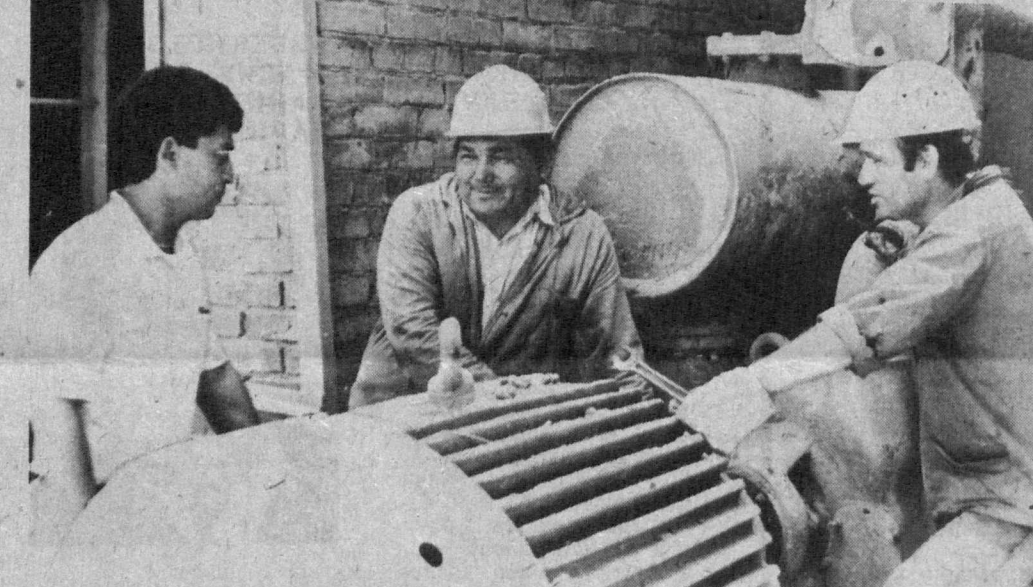
Ишчилар музолат асосида...

роқ ишониш керак. Мен шундай фикрдаман. Тўғрала корхонамизнинг директорлари ҳам чегасидан ўт чақнайдиган, янгилликка ўч навқиролашди. Биз доимо ба-маслаҳат иш юригамиз. Бир мисол. Қишлоқлардаги сув иншоотлари учун ишла-тиладиган катта ҳажмдаги бетон қувурларга эҳтиёж камайганда ҳаммаииз тўп-ланйиб фикрлашдик. Қурилиш учун бетондан оддий ғиш ишлаб чиқариш гоёси шу тариқа тўғилди. Ҳозир бу маҳсулотга талаб шу қадар ошиб кетдики, биз уни янада кўпроқ тайёрлаш чобларини излапмиз.