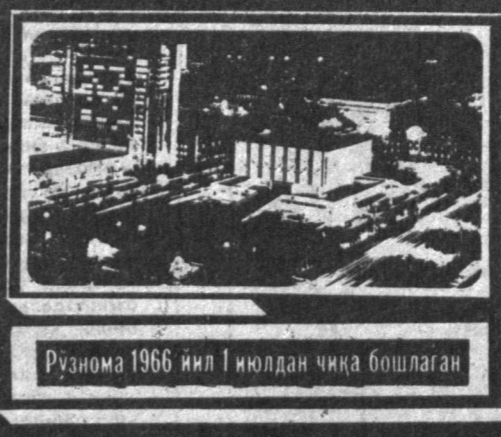
Рўнома 1966 йил 1 июлдан чика бошлаган