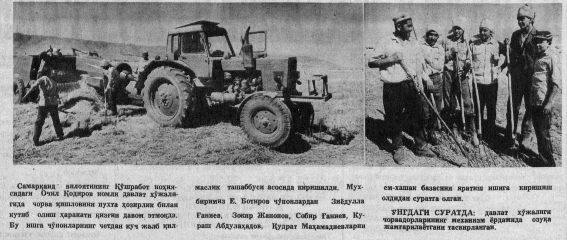
Самарқанд вилоятининг Қўшробот ҳўшрасидаги Очил Қодиров номида давлат хўжалигида чорва қишлоқини пухта ҳозирлик билан кўтиб олиш ҳаракати қизғин давом этмоқда. Бу ишга чўпонларнинг четдан куч жалб қилинади.

Совет Социалистик Республикалари Иттифоқининг Президенти М. Горбачев. Москва, Кремль, 1991 йил 7 сентябрь.