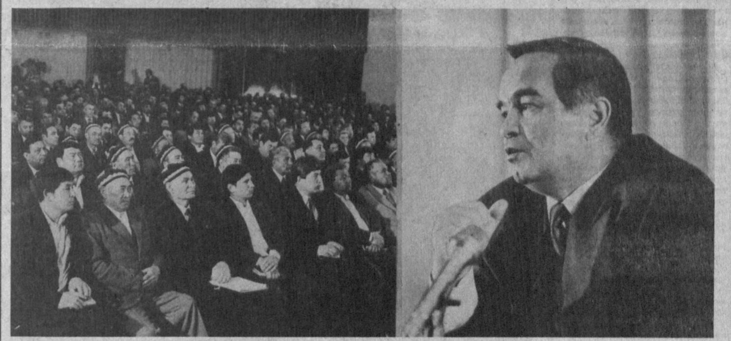
НА СНИМКАХ: во время встречи.

Президент Республики Узбекистан И. КАРИМОВ гор. Ташкент, 26 марта 1992 года.