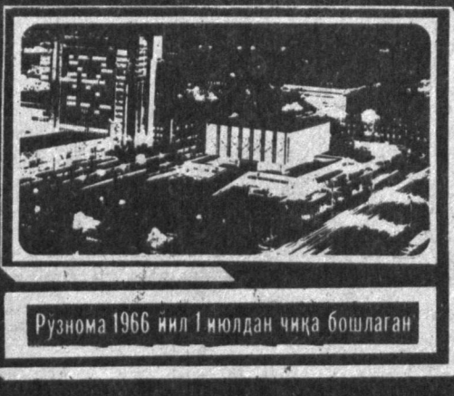
Рўзнома 1966 йил 1 июлдан чиқа бошлаган

Литва собиқ ССР Иттифокнинг учта республикаси билан савдо-иқтисодий битимики имзоланди. Иқтисодий вазири Альбертас Шименас Озарбайжон Республикаси, Қирғизистон ва Тожикистонга қилган сафаридан қайтган ана шуни маълум қилди.