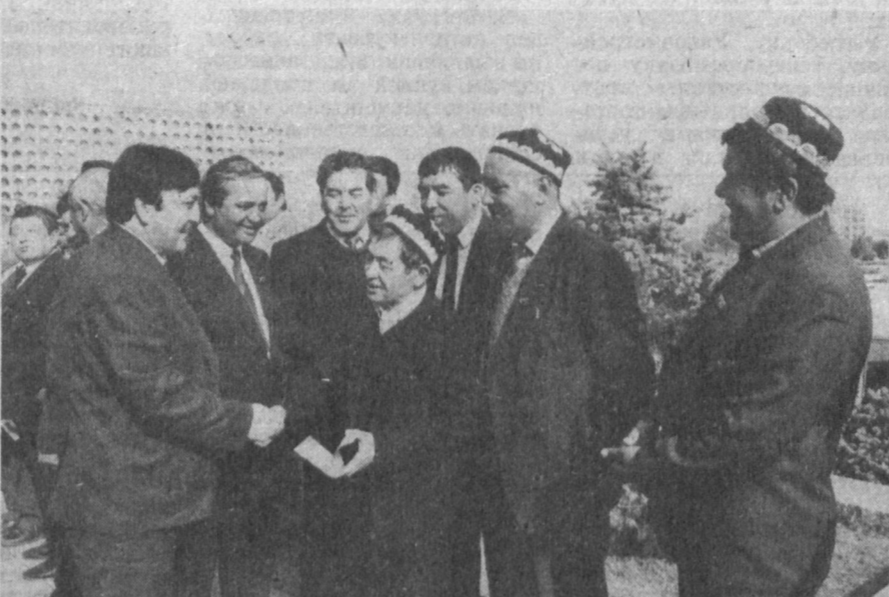
НА СНИМКАХ: во время курултая.