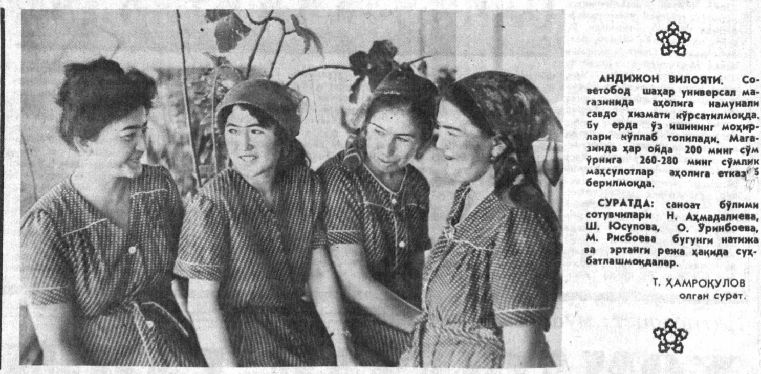
АНДИЖОН ВИЛОЯТИ. Советобод шаҳар университет магазинада аҳолига намунавий савдо хизмати кўрсатишмоқда.

Биз Нусрат Аъзамович билан узок суҳбатлашдик. Мавруди келиб унинг фикр-мулоҳазаларини батафсил мақола қилиб ёзарман. Бугун эса домланинг олтимш ашга тўлиши арасида гапни мухтасарроқ қилмоқчиман.