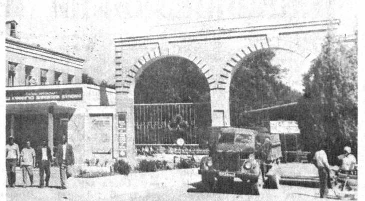
Жўма пахта тозалаш заводи. Бошқариш раёонидаги эмас, Самарқанд вилоятидаги энг катта корхоналардан бири ҳисобланади. 29 минг тонна пахта қабул қилиш имкониятига эга бўлган заводда зарур барча механизмлар мавсумга тахт қилиб қўйилди. СУРАТЛАРДА: 1. Заводнинг умумий кўриниши. 2. Қабул қилинадиган маҳсулотларнинг сифат даражасини белгиловчи лаборант Улуғой Топшўпатов таъйр усулларини яна бир бор кўздан кечирмоқда. 3. Пахта қабул қилиш майдони.

Дўла бошлик терговчилар гуруҳидан ҳайратланарини — яқин ўтмиш андозаларидан бири. Ушбу гуруҳ ўз ишида кўпчилик 30-йиллардаги жинояткорона усуллардан фойдаланган. Бунга ўзим гувоҳман. Террорчилик вазири ҳам ҳукм сурган, 1988 йлда Бухородаги музей-қўриқхона жамоасини ёқлаб ёган мақоламини варақа шаклида босиб чиқарганларини, мусодара қилганларида эса кўла кўчириб, худди босиб олинган шаҳарлардаги киб деворларга ёширтганларини билди, қандай изтироб чекканлигим эсимда. Терговчилар жумҳуриятдан юзлаб, минглаб «жинотчиларни» «топган эканлар», бу гдлийчиларнинг хизмати эмас. Тузум минглаб кишиларни жинотчиларга айлантирган. Бинобарин, бу нафақат Ўзбекистонда бўлган балки бутун мамлакатга тарқалган эди. Мана шу жирканч ширавахўр тузуми марказ яратган. Балиқ боши-