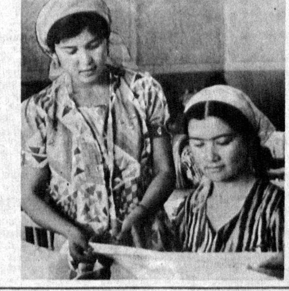
7. Оқтўбрий революцияси ордени «Бешариқ» совхози Киров районидagi пеш қадам хўжаликлардан бири. Қишлоқ хўжалигида ўзини оқлаётган ижара пудрати бу ерда ҳам кенг қулланилмоқда.

6. Оқтўбрий революцияси ордени «Бешариқ» совхози Киров районидagi пеш қадам хўжаликлардан бири. Қишлоқ хўжалигида ўзини оқлаётган ижара пудрати бу ерда ҳам кенг қулланилмоқда.