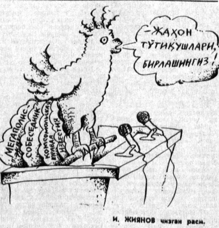
И. ЖИЯНОВ чизган расм.