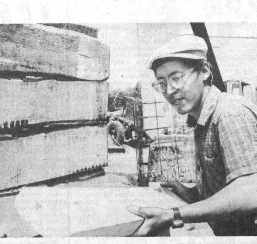
Республикамизда кейинги йилларда деҳқончилик, қишлоқ хўжалиги маҳсулотлари етиштирувчиларга қўлайлик яратиш борасида ибратли ишлар амалга оширилмоқда.

зациялашган кўчма колонна-си ишчилари қурмоқдалар. Усталар ғайрати туйғайли қурилиш ишлари шу кунларда тугатилиб, бозорни ишга тушириш мўлжалланмоқда.