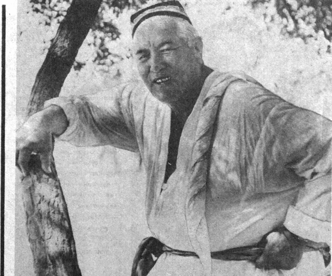
ПАХТАЗОРДА ЧИНИҚҚАН ПОЛВОН

Татаристонда Алишер Навоий асарлари XVI асрдан бошлаб кенг ёйла бошлаган эди, деб айтади адиб Шокир Абилов. Шундан буюн Навоий асарлари татар шоирлари учун илҳом чашмаси бўлиб келади. Навоий сиймоси эса доғистонликнинг тимсолига айланган. XVI асрнинг истеъдодли шоири Муҳаммаднинг Алишер Навоий даҳосидан энг кўп баҳраманд бўлганлиги унинг «Тухфат мардон» асаридан аниқлаш мумкин.