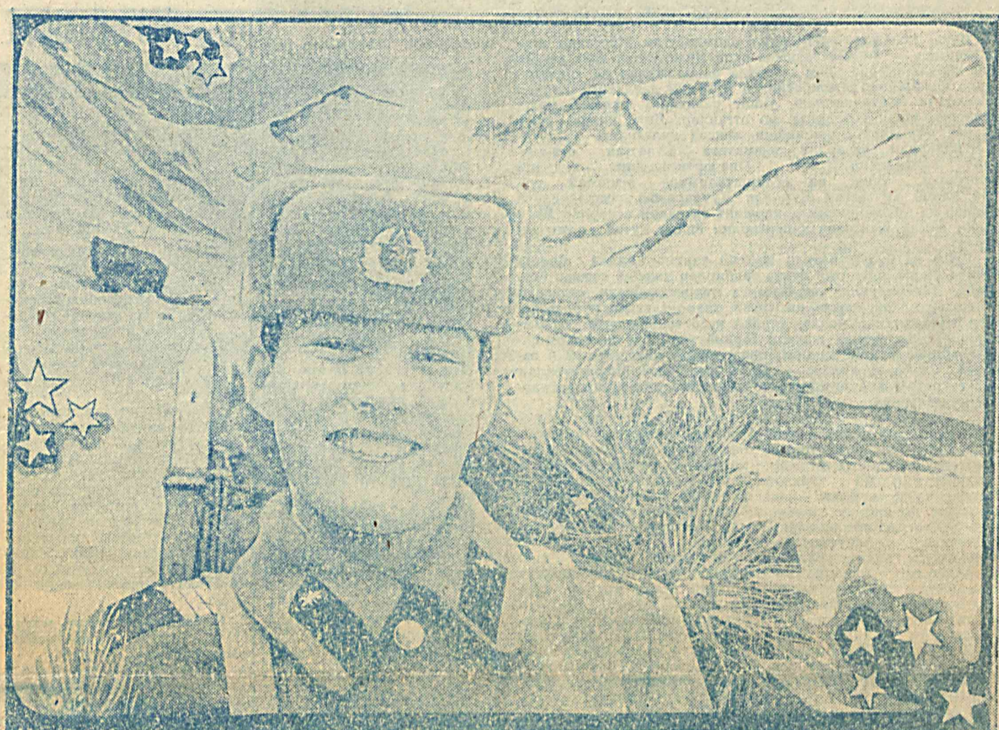
АССАЛОМ, ЯНГИ ЙИЛ!

Чальник ТВОКУ: — Преподвательский состав, офицеры, курсанты, солдаты и сержанты с воодушевлением восприняли решение сессии Верховного Совета об установлении Дня защитников Родины. Личный состав нашего прославленного училища, как и все воины-узбекистанцы, неустанно совершенствует практическую выучку и теоретические знания, применяет все силы и энергию для дальнейшего укрепления обороноспособности Отчизны. Являясь кунчицей офицерских кадров для Вооруженных Сил республики, училище располагает всем необходимым для подготовки грамотных и преданных народу и Президенту командиров.