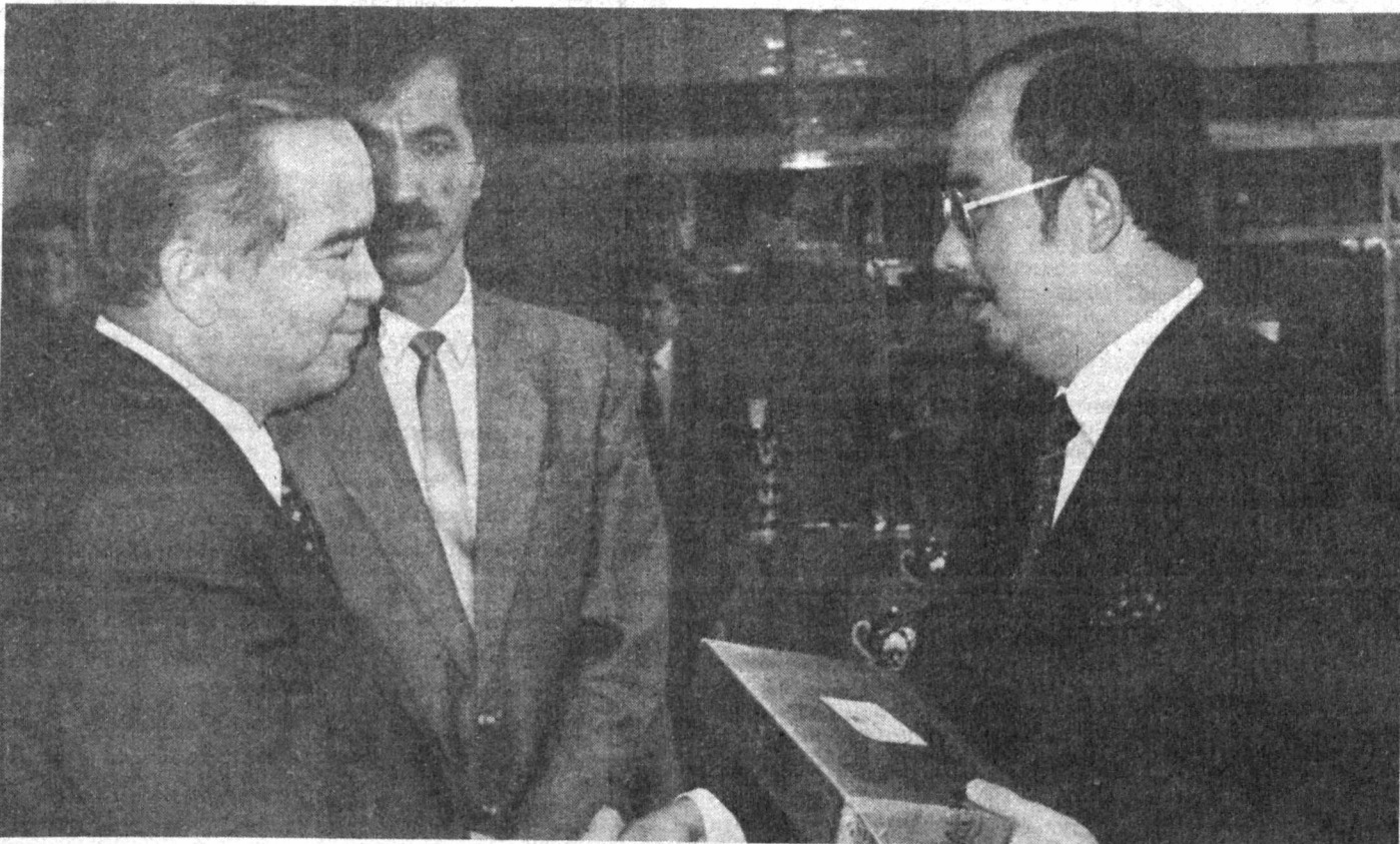
СУРАТДА: қабул пайти.