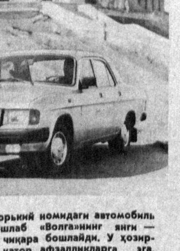
Нижний Новгород. Горький номидаги автомобил заводи 1972 йилдан бошлаб «Волганин» аниги — ГАЗ-31029 моделини чиқара бошлади. У ҳозирги машинани илҳобат қатор афзалликларга эга. Жумладан, дивантеги бакуватор, узатиш қўтири ва бола хоналари, ошқона, юмшқоқ мебель, хоридан қилинган радио ва телеаппаратлар билан жиҳозланган дам олиш хонаси мавжуд. Пулак ва палаталардаги гилам поёндоқлар ҳам шинамлик бахш етасди. СУРАТДА: ГАЗ-31029.

Красноярск ўлкаси: «Сибволонд» заводи ҳар йили буртомачиларга 65 минг тоннадан кўнроқ суний тола жўнабди. Пахта ўрини босувчи бу тола — «Сиблон» деб аталади. У табиий толадан илҳорлаб ташиқилган, наллиқча чидаллиги билан ажралаб туради. Сибир «пахта»нинг маънавий-маърифат қатор тўқимачилик корхоналари хол ашб сифатда фойдаланишляпти. СУРАТДА: «Сиблон» кўнринишдан ҳақиқатан ҳам пахтага ўхшайди.