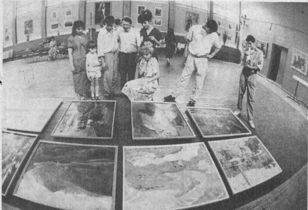
Пойтахтимиздаги саъват мактаб-интернатда таълим олаётган иқтидорли ёшлардан жуда кўп иқдорли асарлар кутинишимиз тайин...

Тошкент вилоят маҳаллий саноат бошқармасининг бошлиғи.