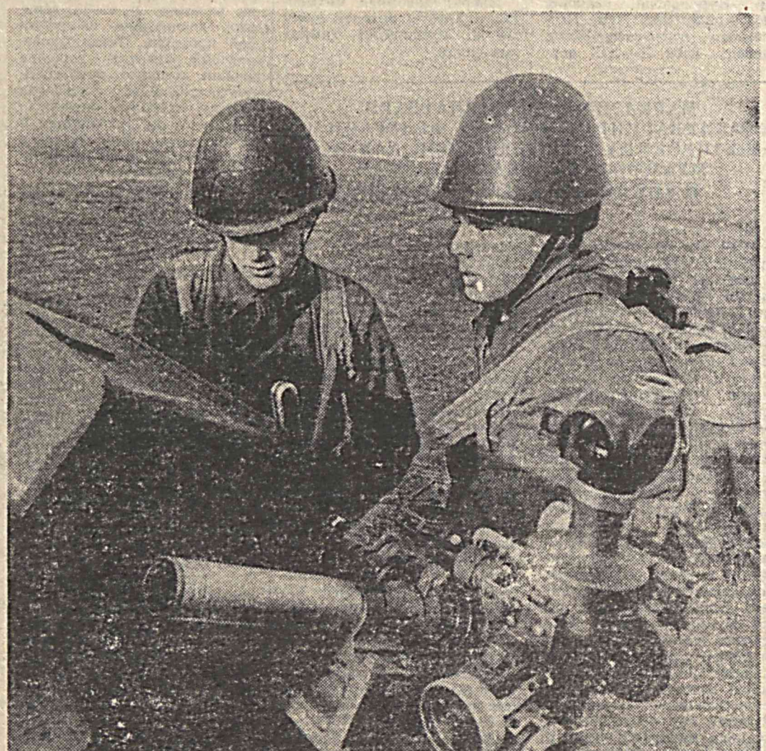
Ўз бурчиға содиқ аскарлар Ватан ҳимоячилари кунини қишки мавсум ўқув