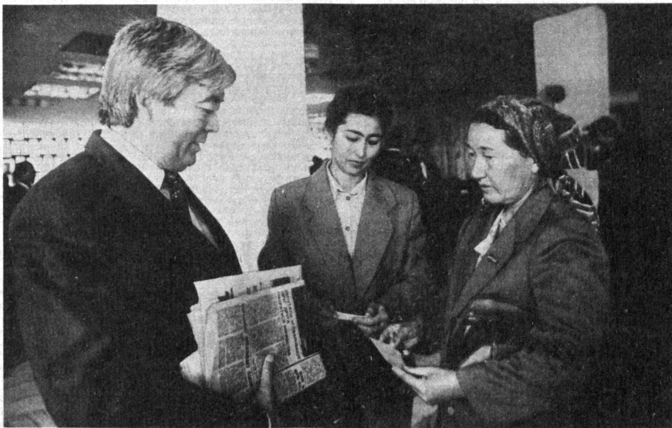
Ўзбекистон Халқ-демократик партияси таъсис қурултойи делегатлари танаффус пайтида.