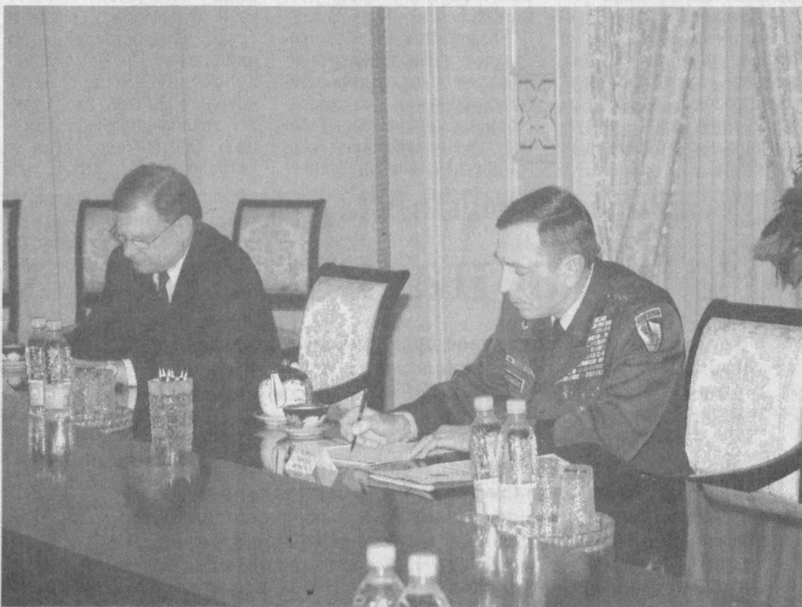
ство с США также отвечает интересам Узбекистана.

возможность для обмена мнениями по вопросам сотрудничества и ситуации в регионе. Узбекистан за взаимовыгодное сотрудничество со всеми странами на основе принципов взаимоуважения и доверия. Сотрудниче-