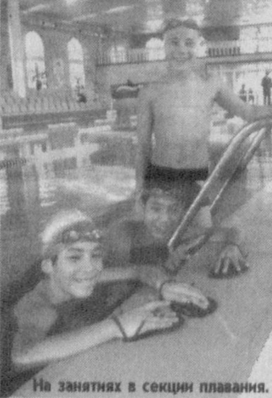
На занятиях в секции плавания.

В доме милосердия № 1 Ходжейлийского района созданы все необходимые условия для воспитанников.