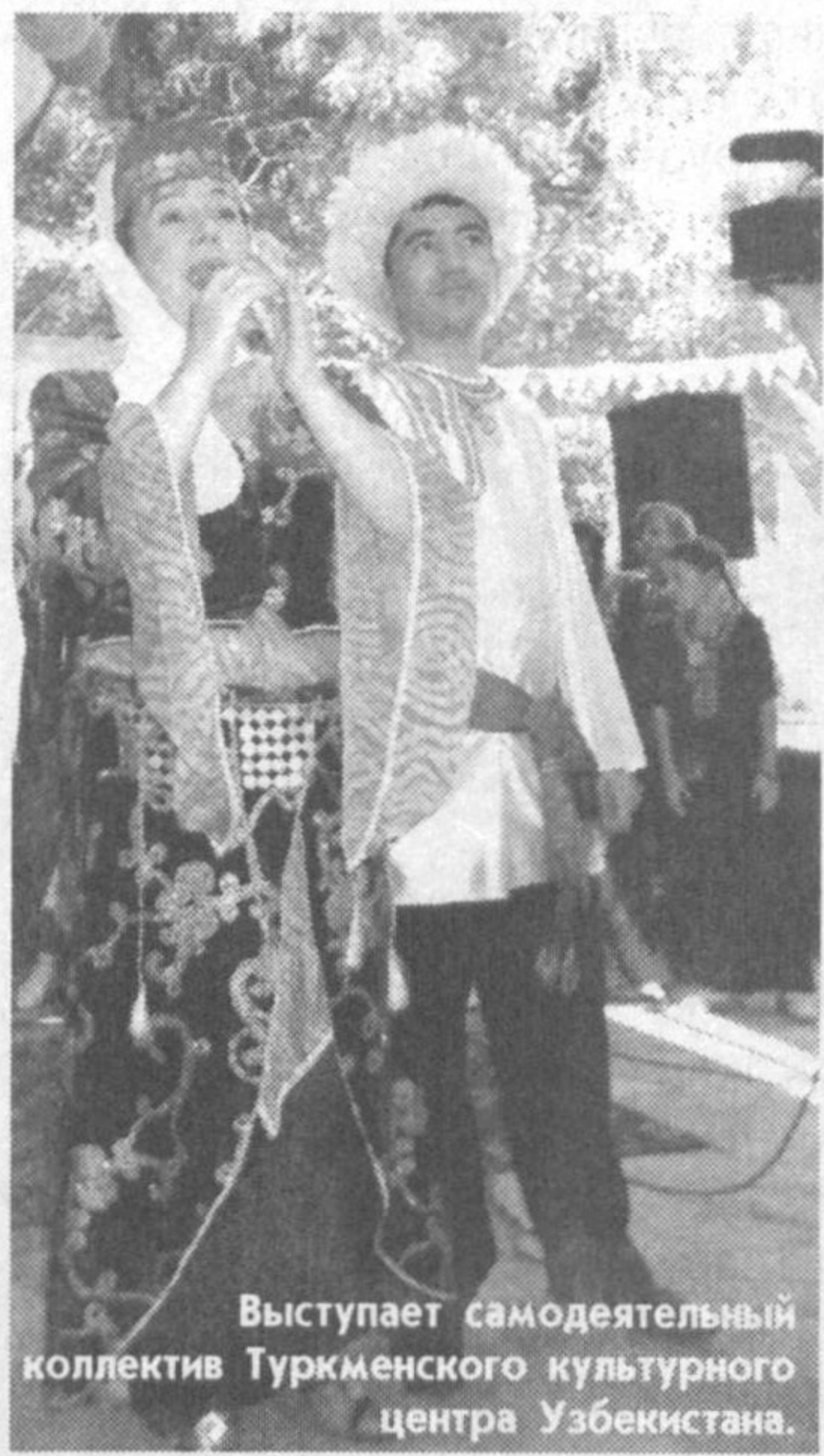
Выступает самодеятельный коллектив Туркменского культурного центра Узбекистана.

Несколько лет работает кружок изучения родного языка, который активно посещают школьники. В Каракалпакистане и Ташкенте действуют самодеятельные туркменские художественные коллективы. Без их участия не обходится ни одно мероприятие. Они регулярно становятся лауреатами общереспубликанского фестиваля-конкурса "Узбекистан - наш общий дом". Их участники - в основном молодежь, а это значит, что ребята интересуются родной культурой, любят ее.