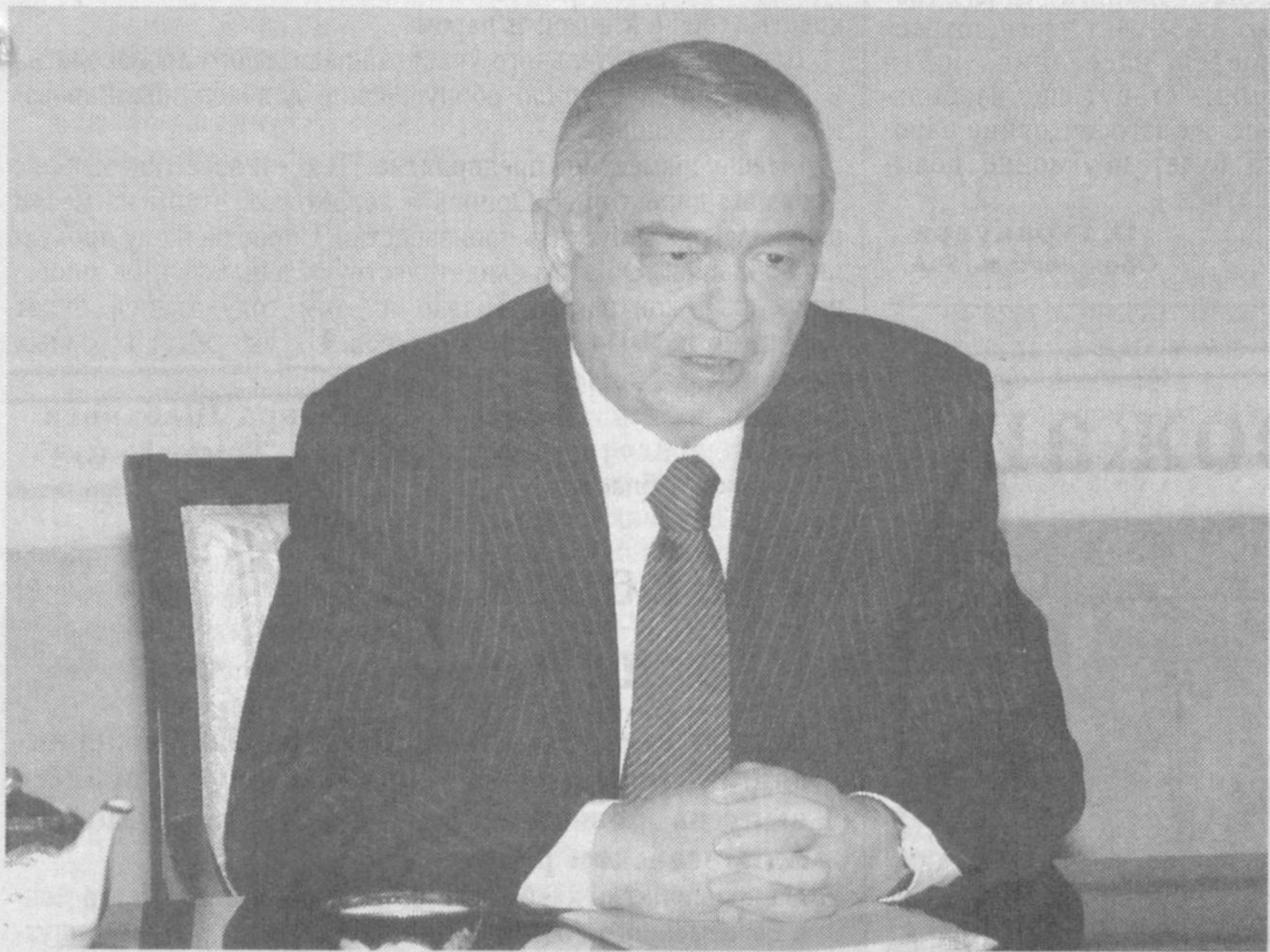
Президент Республики Узбекистан Ислам Каримов 17 февраля в резиденции Оксарой принял командующего Центральным командованием Вооруженных сил США Дэвида Петреуса.

Ваш визит мы считаем важным событием в отношениях между Узбекистаном и США, так как он является первым визитом представителя новой администрации США, - сказал Ислам Каримов. - Эта встреча хорошая