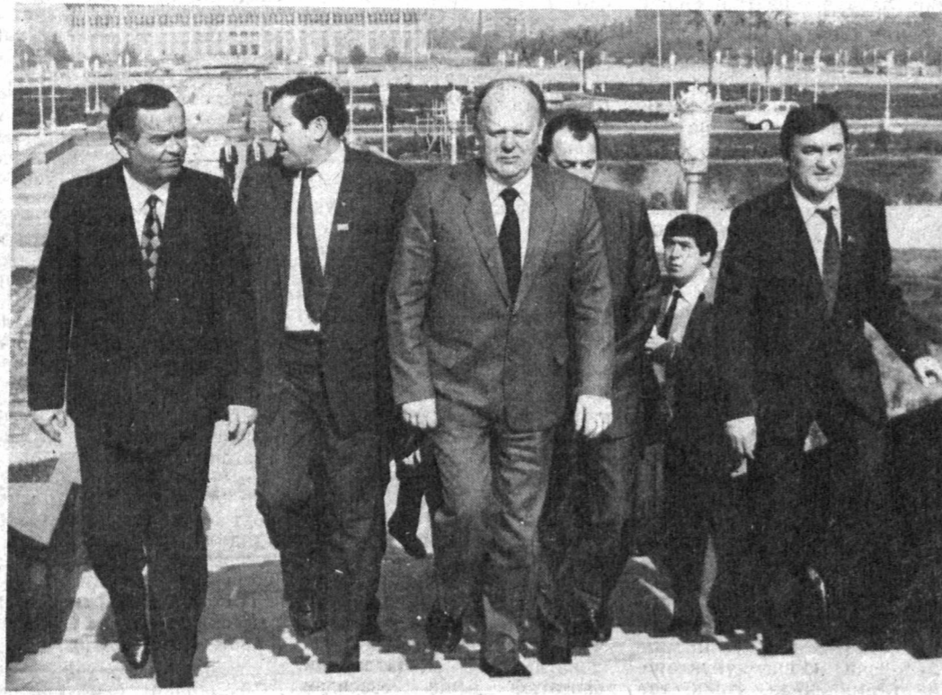
Тошкент билан танишув.