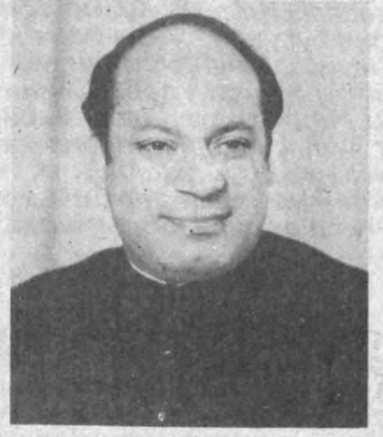
Бўлган М. Н. Шариф кўпчилик овоз олиб, ўша йилнинг 6 ноябидан Покистон Бош вазири лавозимини эгаллаётгани билан боғлиқ.

Ўзбекистон Республикаси раҳбарияти тақдирига буюрди. Покистон Ислам Республикаси Бош вазири Муҳаммад Навоз Шариф бошчилигидаги Покистон расмий делегацияси бугун Тошкентга келди. Муҳаммад Навоз Шариф 1949 йил 25 декабрда Лаҳор шаҳрида туғилган. У Лаҳордаги нуфузли коллежни тугатганидан сўнг, Панжоб университетини ҳуқуқшунослик бўйича ихтисослашган. М. Н. Шариф 1981 йилда сиёсий майдонга кириб келиб, аввало, Панжоб музофотида Молия вазири, сўнг тўққиз йил давомида шу музофот ҳукуматидаги вазирлик ва вазифасида ишлаган. 1990 йил 24 октябрда ўтказилган умумий сайловда Ислам Демократик Иттифоқи партиясининг номзоди