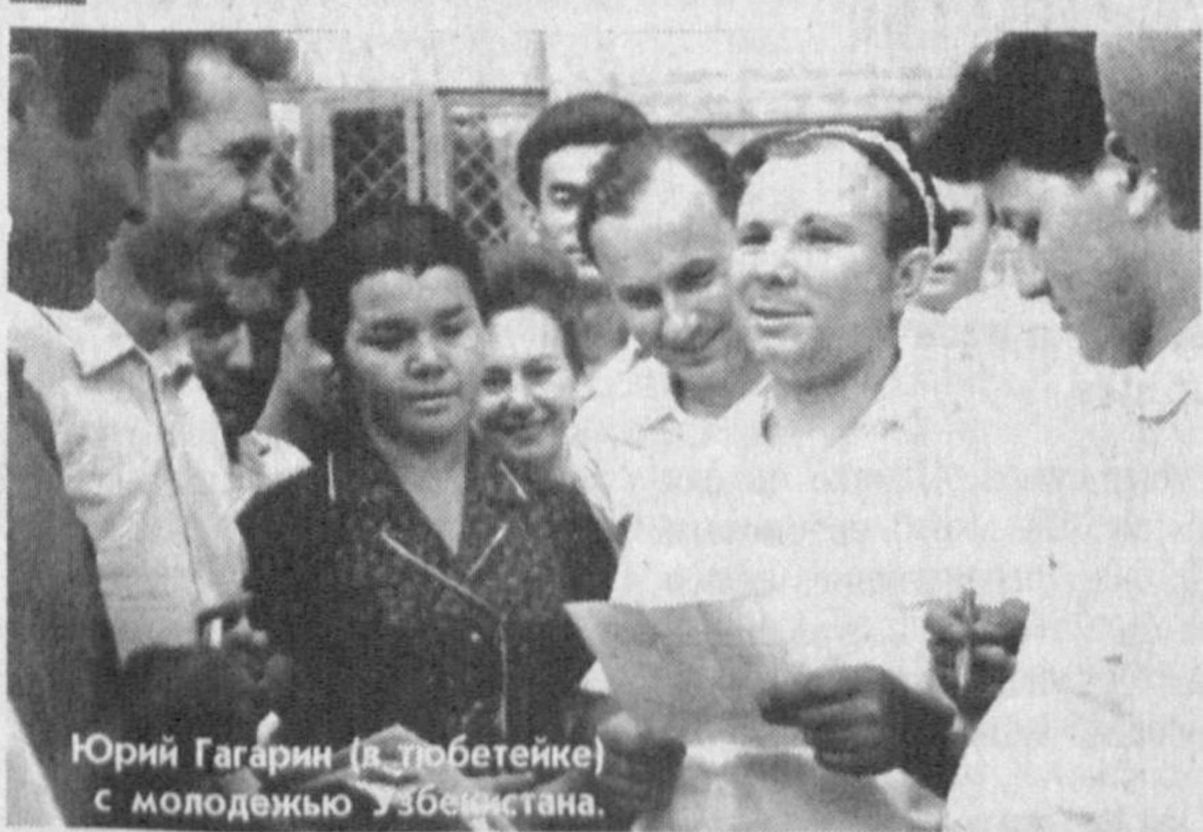
Юрий Гагарин (в центре) с молодежью Узбекистана.