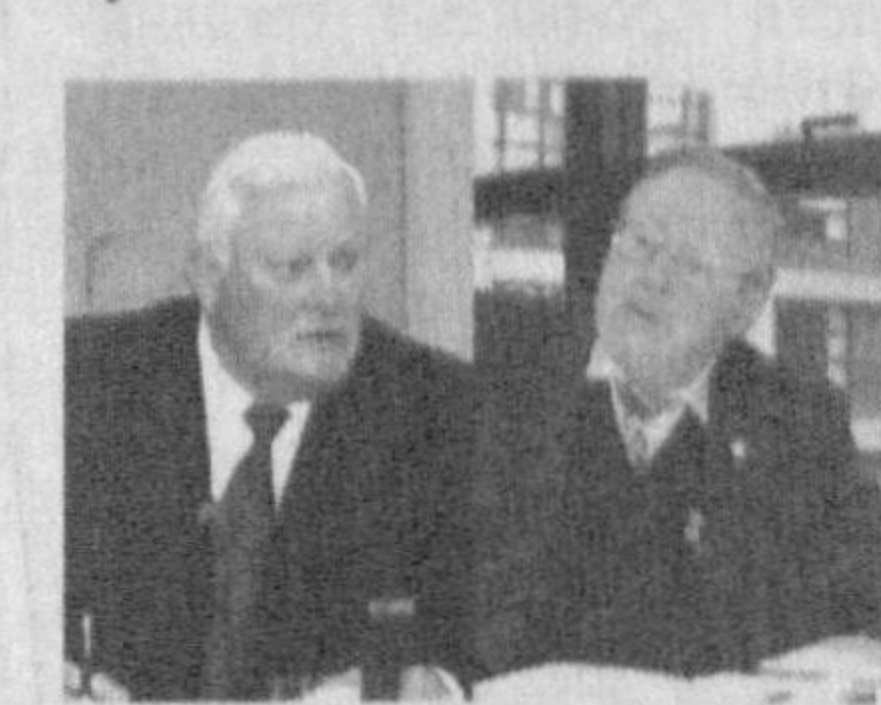
ший лидер консерваторов,

Бывшие руководители Литвы Витаутас Ландсбергис и Альгирдас Бразаускас не будут участвовать в выборах президента Литвы, которые пройдут в мае 2009 года. Быв-