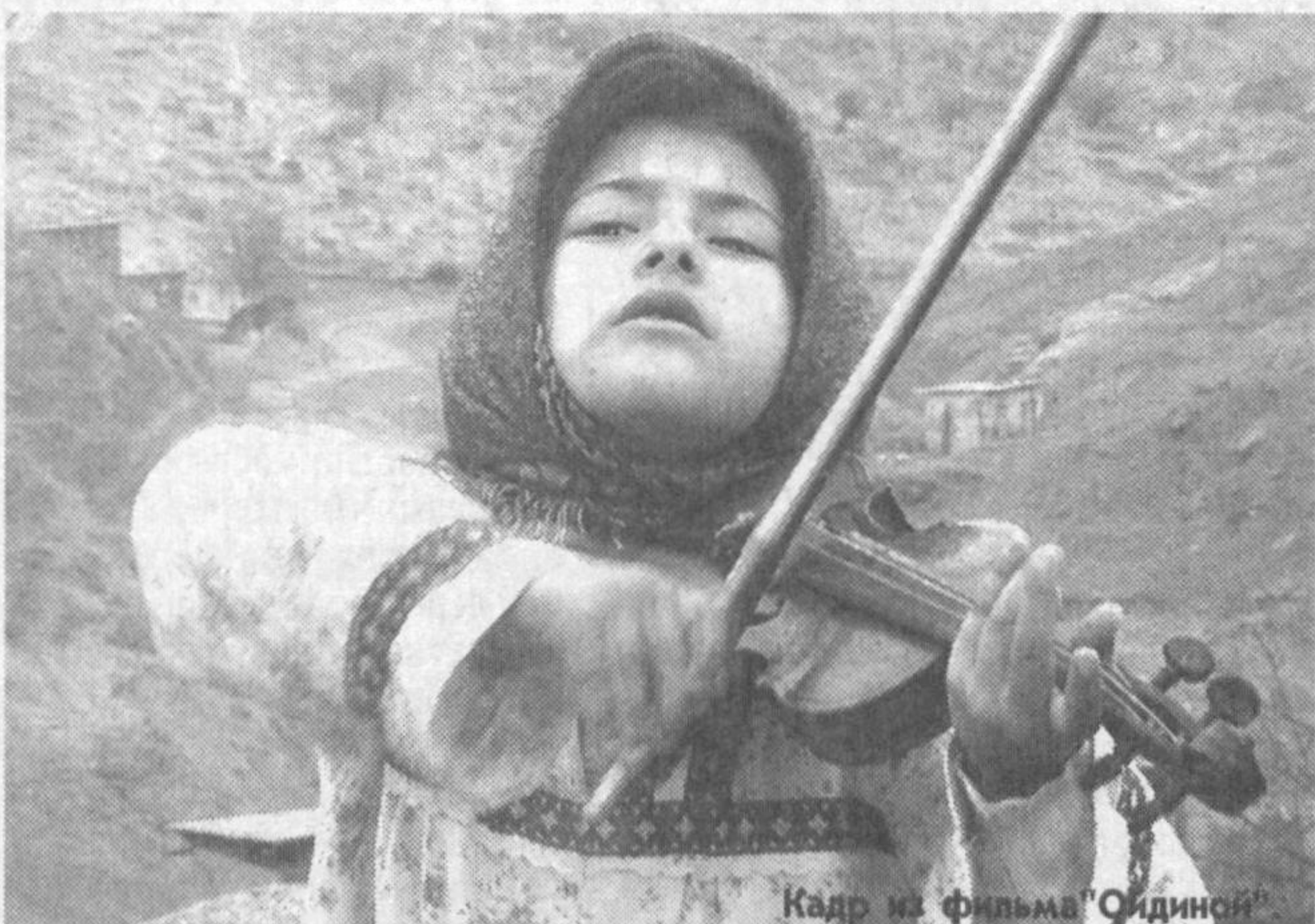
Кадр из фильма "Одиной"

привлекает внимание зрителей богатым этнографическим материалом, подробностями быта. Зритель увидит схватку резвых лошадей, процесс изготовления лепешек особым способом, ковры с необычным орнаментом, древний обряд - купание ребенка в молоке - и яркие национальные костюмы... Далеко от мысли делать скидку на молодость каракалпакского кино, неопытность постановщиков художественной картины. Лента будто снята приезжим кинорежиссером, влюбившимся в этот край, в его людей, но освоившим эстетику лишь документального кино.