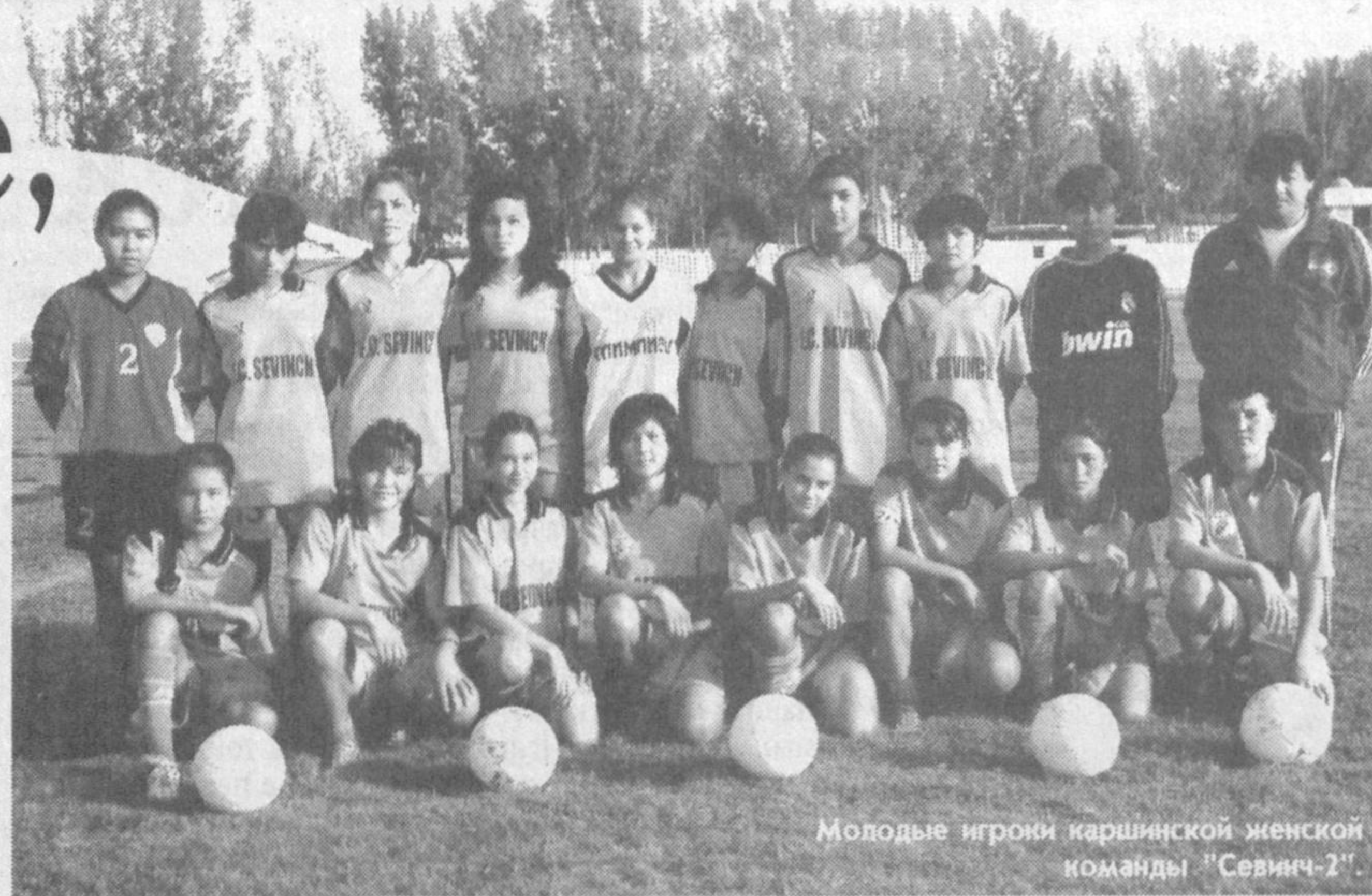
Молодые игроки каршинской женской команды "Севинч-2".