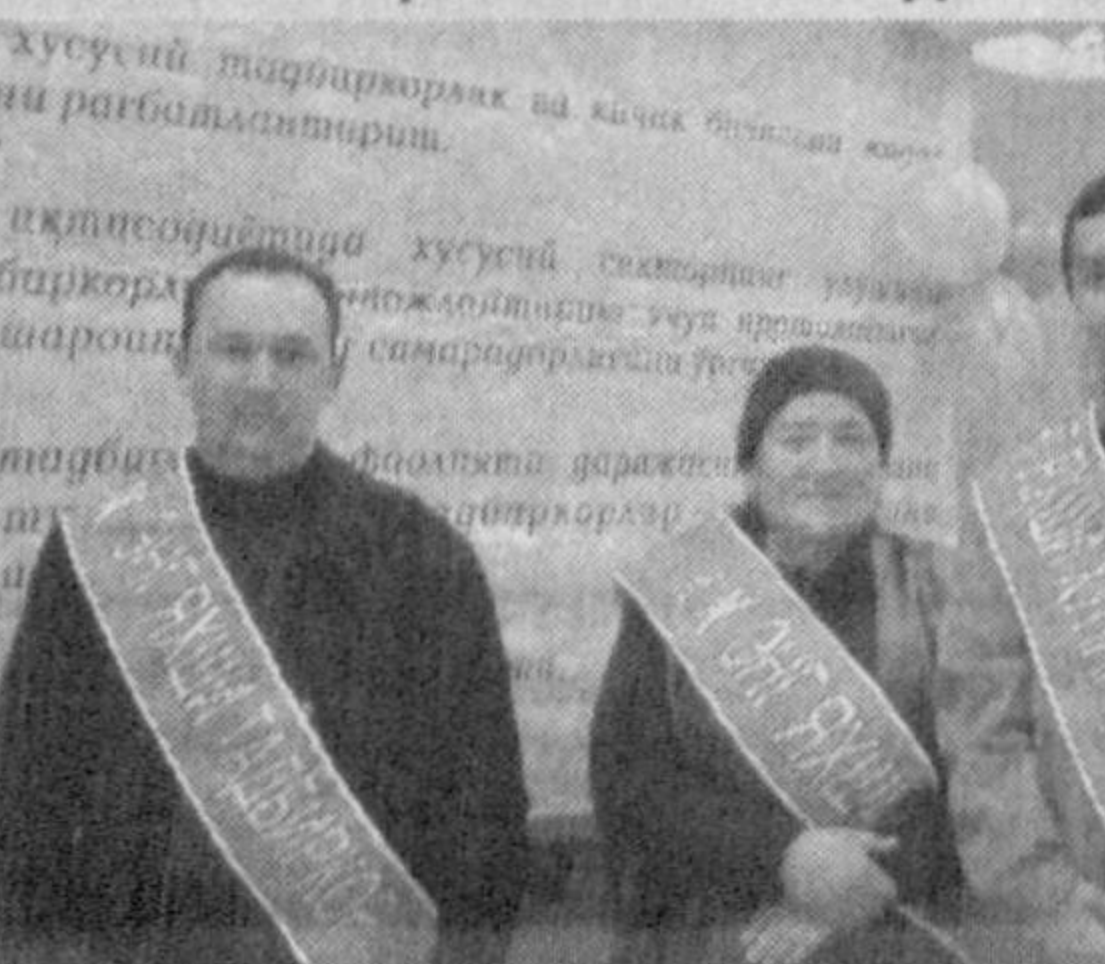
Участники конкурса выставили образцы своих изделий в просторном фойе областного Дома духовности и просветительства. Членам жюри нелегко было определить лучших.

Зебо Хайдарова. Соб. корр. "Правды Востока". Сырдарьинская область.