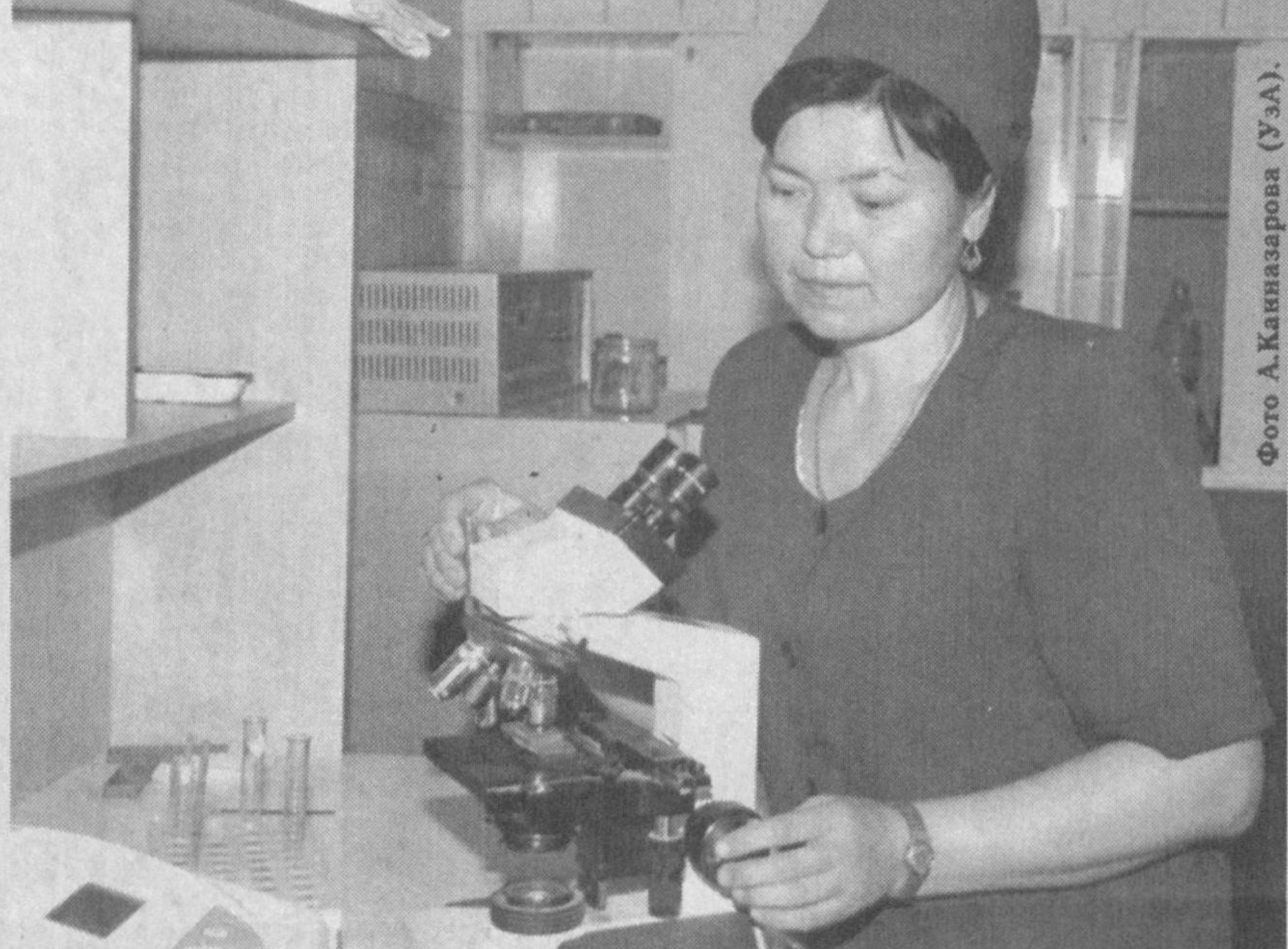
В сельском врачебном пункте "Кукли" Кунградского района созданы все условия для оказания своевременной квалифицированной помощи. СВП оснащен современным медицинским оборудованием. Квалифицированный медицинский персонал помогает сельчанам восстановить здоровье.