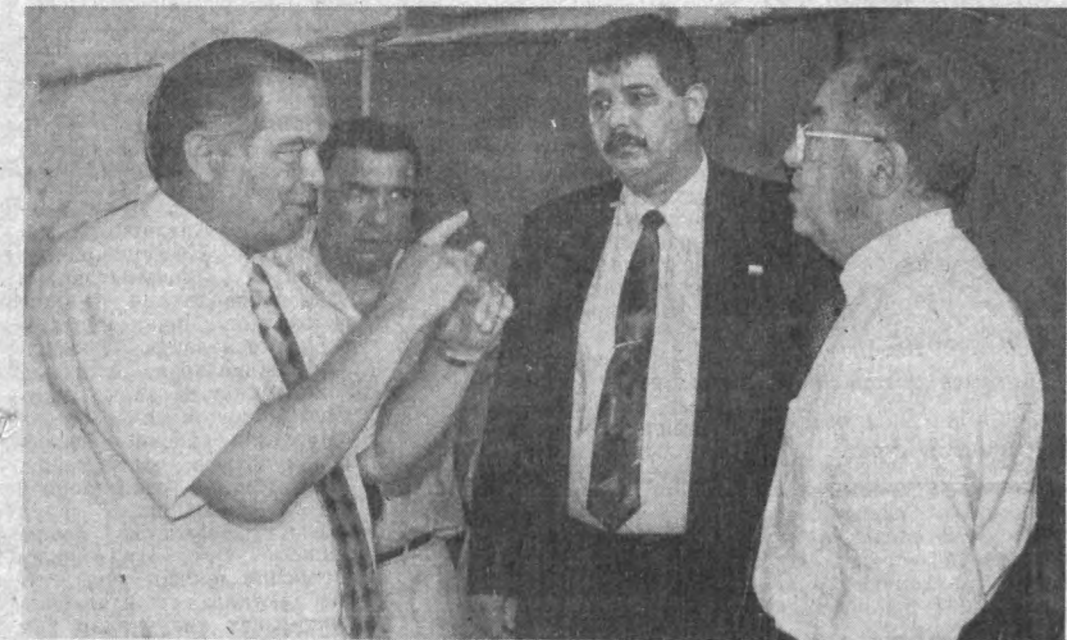
СУРАТДА: Учрашувдан лавҳа.

ЯҚИНДА Олмоннинг жаҳонга машҳур «Мерседес-Бенц» автомобилсозлик компанияси директорлар кенгаши президенти Вернер Ниефер Ўзбекистонга келди. Унга компаниянинг бир гуруҳ етакчи мутахассислари, инженирлари ҳамроҳлик қилмоқда.