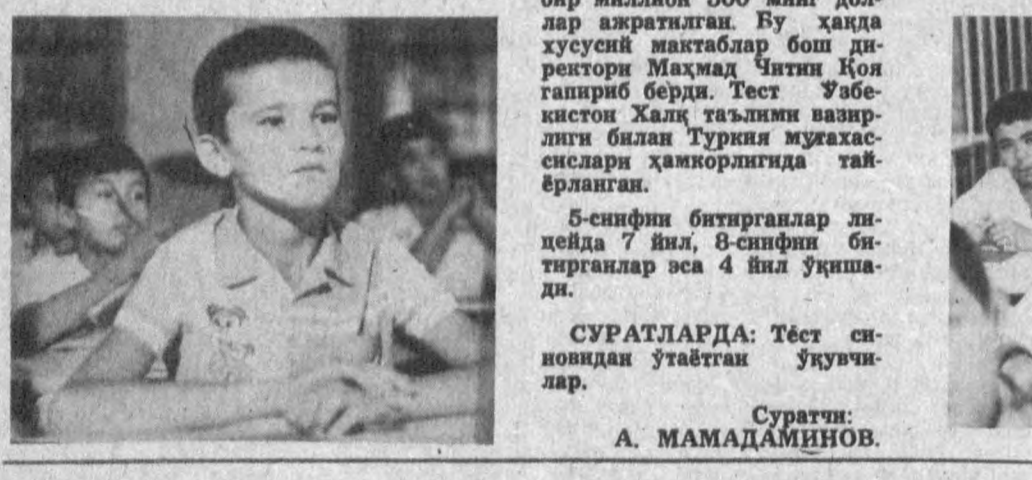
5-синфин битирганлар лицейда 7 йил, 8-синфин битирганлар эса 4 йил ўқишади.

Тошкентдаги 50-мактаб гимназиясида 800 нафарга яқин 5-ҳафта 8-синф битирувчилари тест сновидан ўтдилар. Сновга дош берган юз нафар ўқувчи пойтахтнинг Ҳавза ноҳиясида бу йил — янги ўқув йилидан бошлаб ўз фаолиятини бошлайдиган эриқлар лицейига қабул қилинади. Улар бир йил давомида инглиз ва турк тилларини мукаммал ўрганишади. Дарсларини турк ва ўзбекстонлик муаллимлар олиб боришади. Эриқлар лицейи фаолияти учун Туркия томонидан бир миллион 500 миң доллар ажратилган. Бу ҳақда хусусий мақтаблар бoш директори Маҳмад Чатин Қоя гапириб берди. Тест ўзбекистон Халқ таълим вазирилик билан Туркия мухасислари ҳамкорлигида тайёрланган.