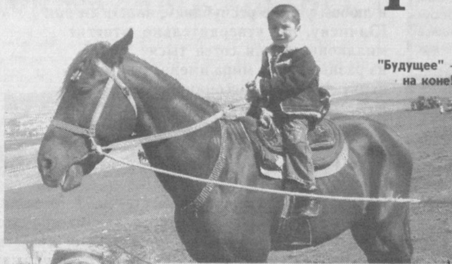
"Будущее" - на коне!

Наталья Шакирова. Соб. корр. "Правды Востока". Самаркандская область.