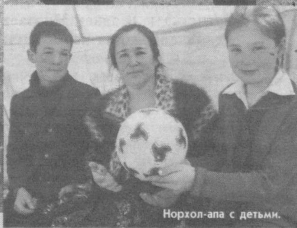
Норхол-апа с детьми.

Главный стержень экономики края - фермерство и каракулеводство. Зерно и сафлор, виноградники и бахчи, источающие аромат вкуснейших дынь, каждый гектар земли стараются фермеры сделать щедрым, доходным. И государство в этом помогает. В маловодном краю строится крупное водохранилище "Акчобсай". Первую очередь на семь миллионов кубометров воды сдали в декабре прошлого года.