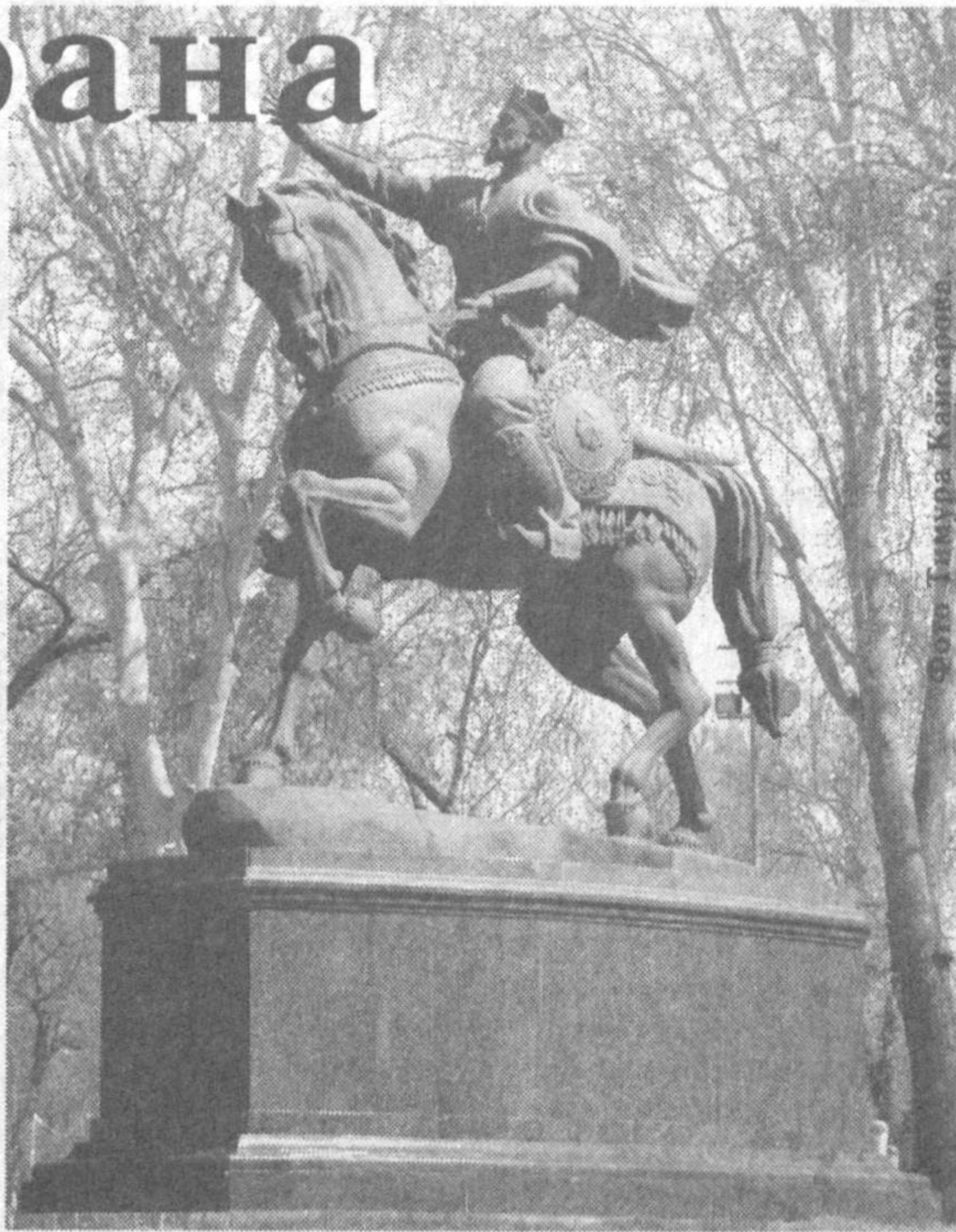
Темур и как покровителя науки и просвещения. Историки констатируют, что Амир Темур очень высоко ценил значение науки и знаний. Часто приглашал к себе знаменитых ученых, историков, философов, религиозных деятелей, вел с ними беседы по различным вопросам.