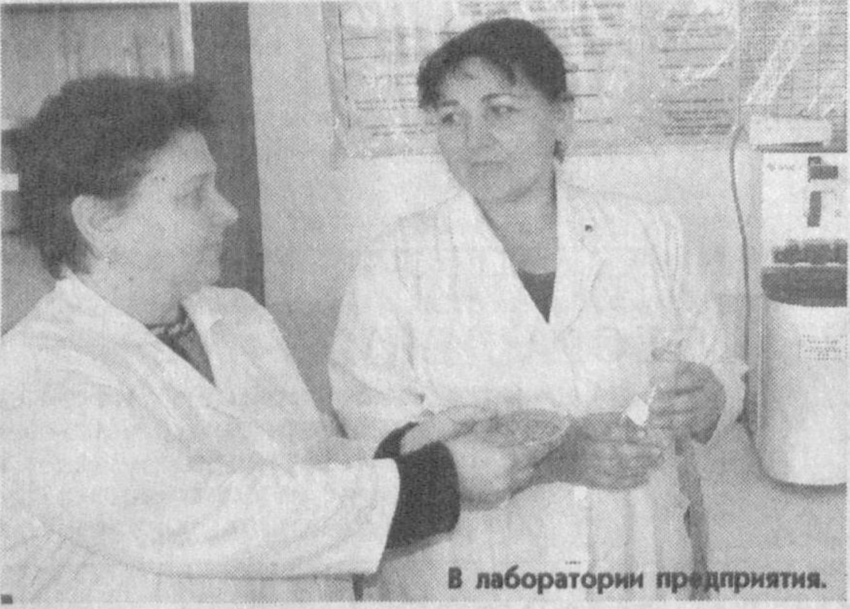
В лаборатории предприятия.