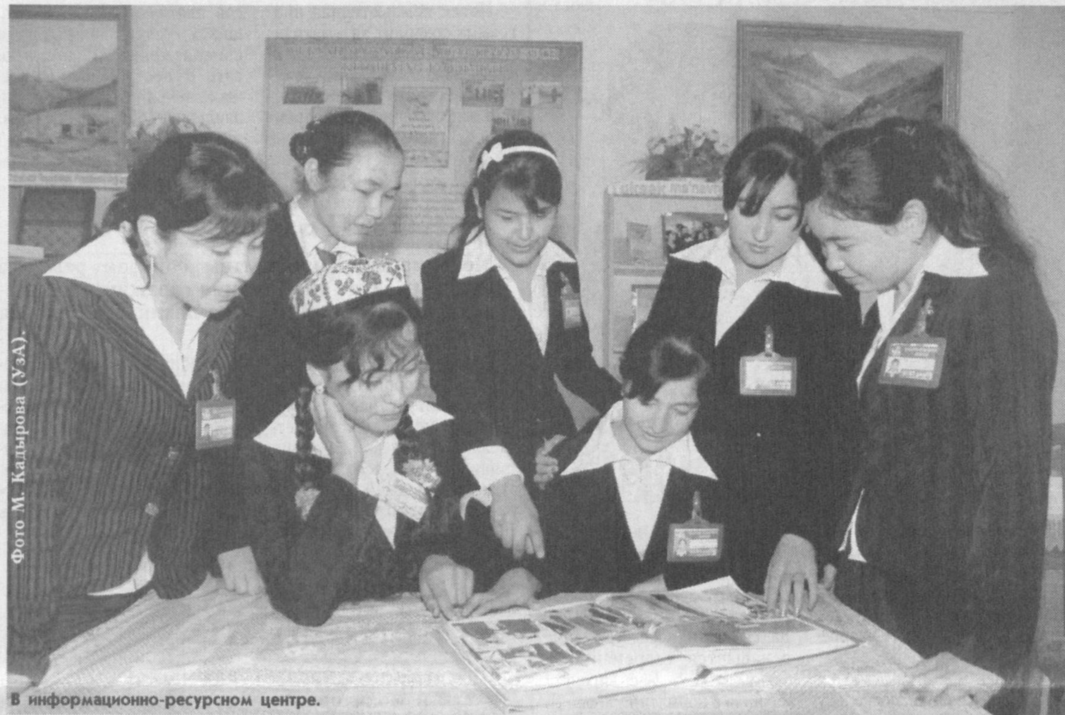
В информационно-ресурсном центре.

Багдадский педагогический колледж готовит специалистов по четырем направлениям. Учатся более тысячи юношей и девушек. К их услугам - современные средства техники, информационно-ресурсный центр, учебные кабинеты. Здесь также - спортивные секции. В этом году колледж окончат 378 выпускников. Ведется работа по их трудоустройству.