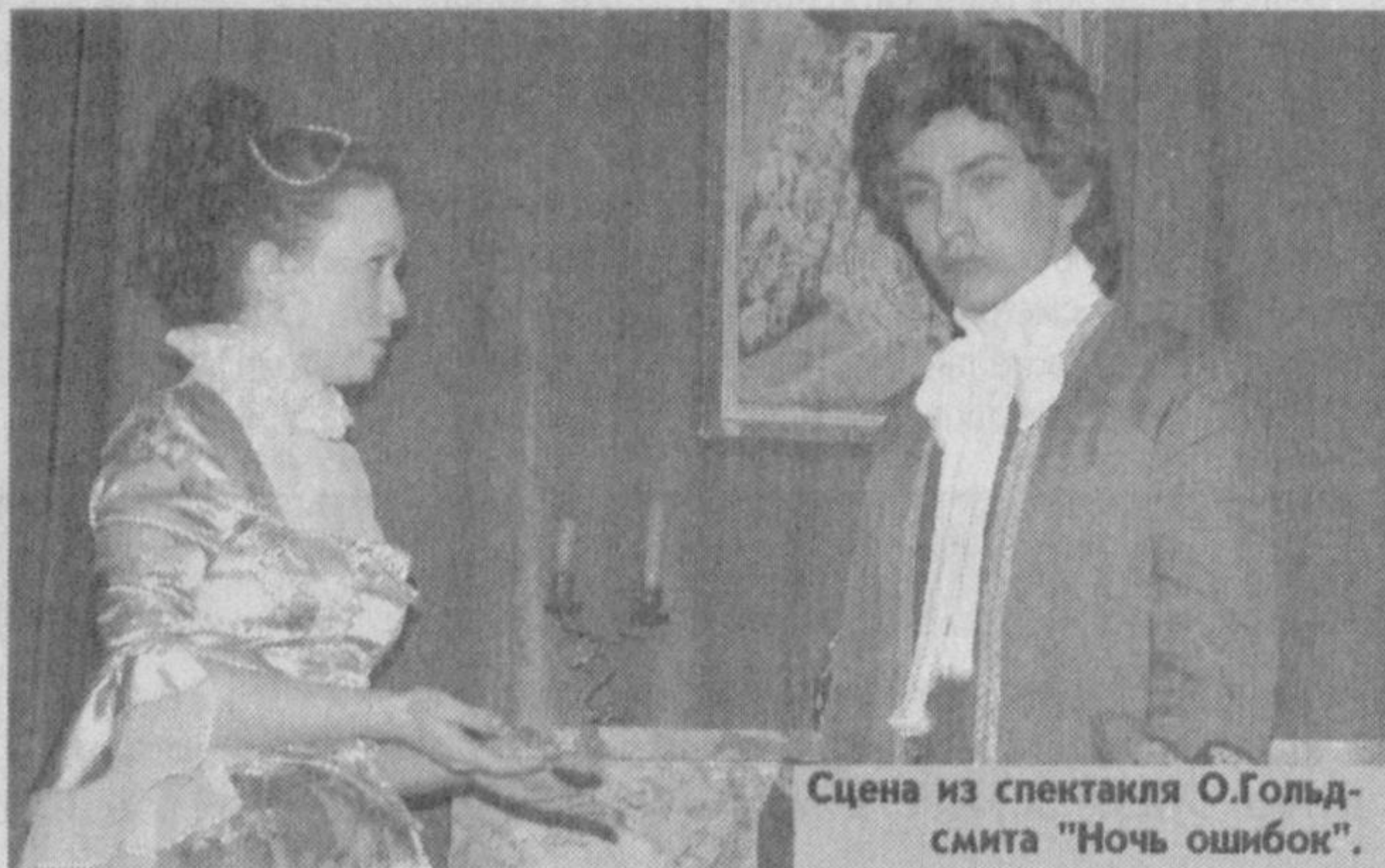
Сцена из спектакля О.Гольдсмита "Ночь ошибок".

в Опале. Мавзолеем Махмуда Кашгари, названный "Гробница священного учителя", посещают многочисленные паломники, чтобы поклониться праху великого ученого. Махмуд Кашгари учился в известном в те времена медресе Сажия, которое окончил