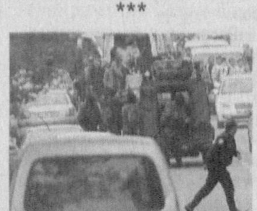
На западе Турции в ку-

пунктам обвинения, включая материальную поддержку терроризма и ведение войны против США. Ему грозит до 70 лет заключения. Остальные приговорены к срокам лишения свободы от 30 до 50 лет.