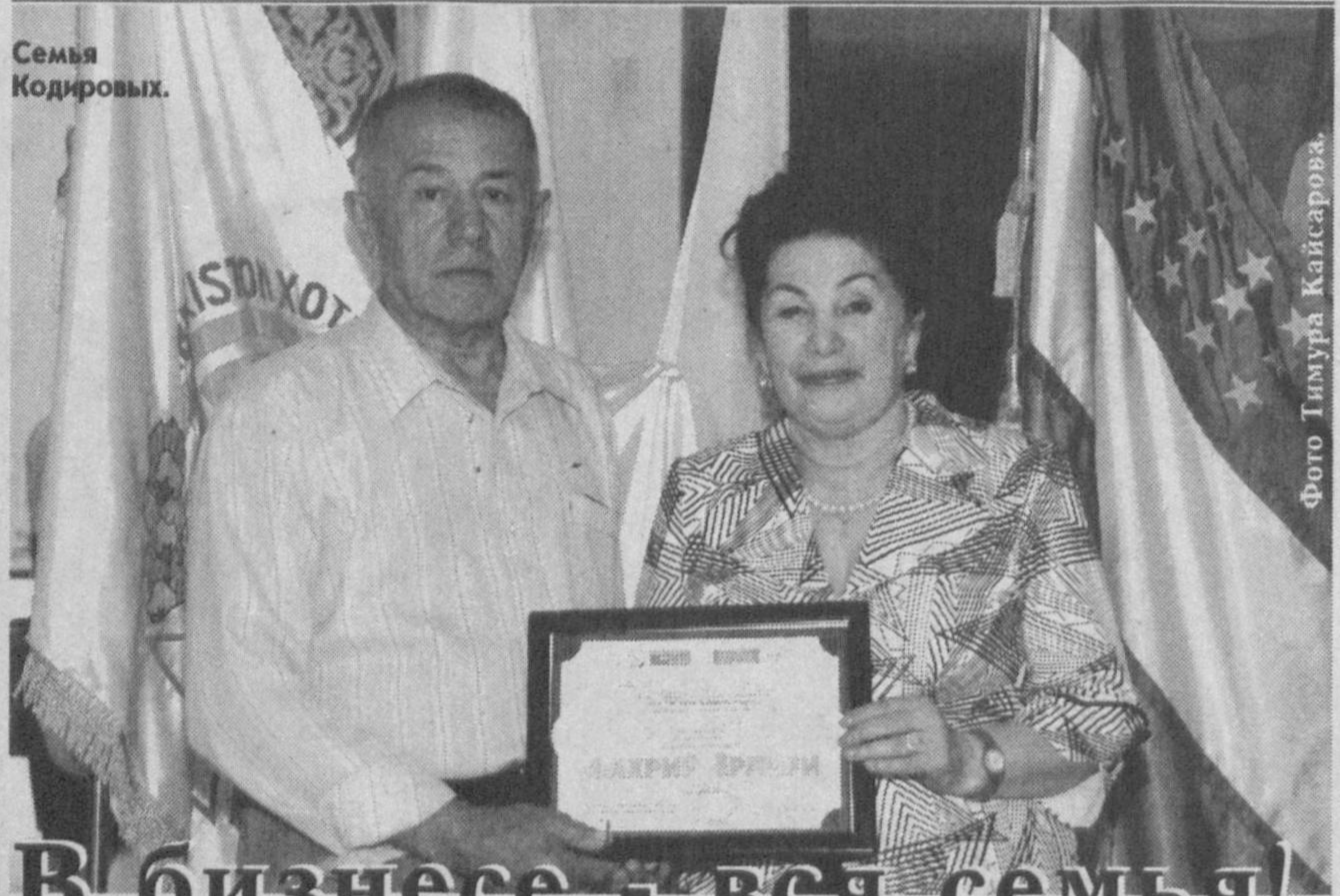
Семья Кодировых.

Турсунмурод Кушаков. Корр. газеты "Сурхон Тонги". Сурхандарьинская область.