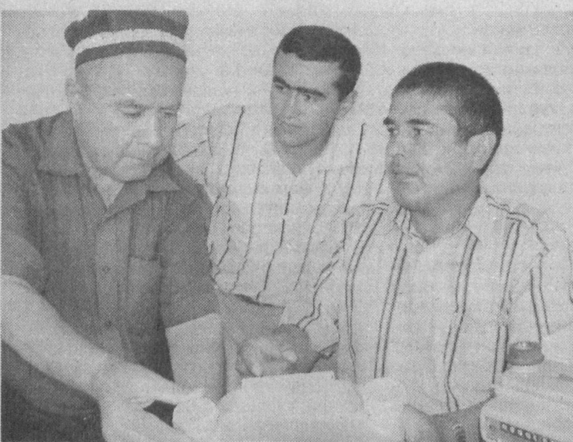
Қизилтепа туманида ҳам аҳолининг табиий газга бўлган эҳтиёжини қонди-ришга катта аҳамият берил-моқда. Ҳозир тумандаги де-ярли барча хонадонлар газ-лаштирилиб бўлиди. Хона-донларга газ ўлچагичлар ўрнатиш ҳам жадал суръат-ларда олиб борилмоқда.