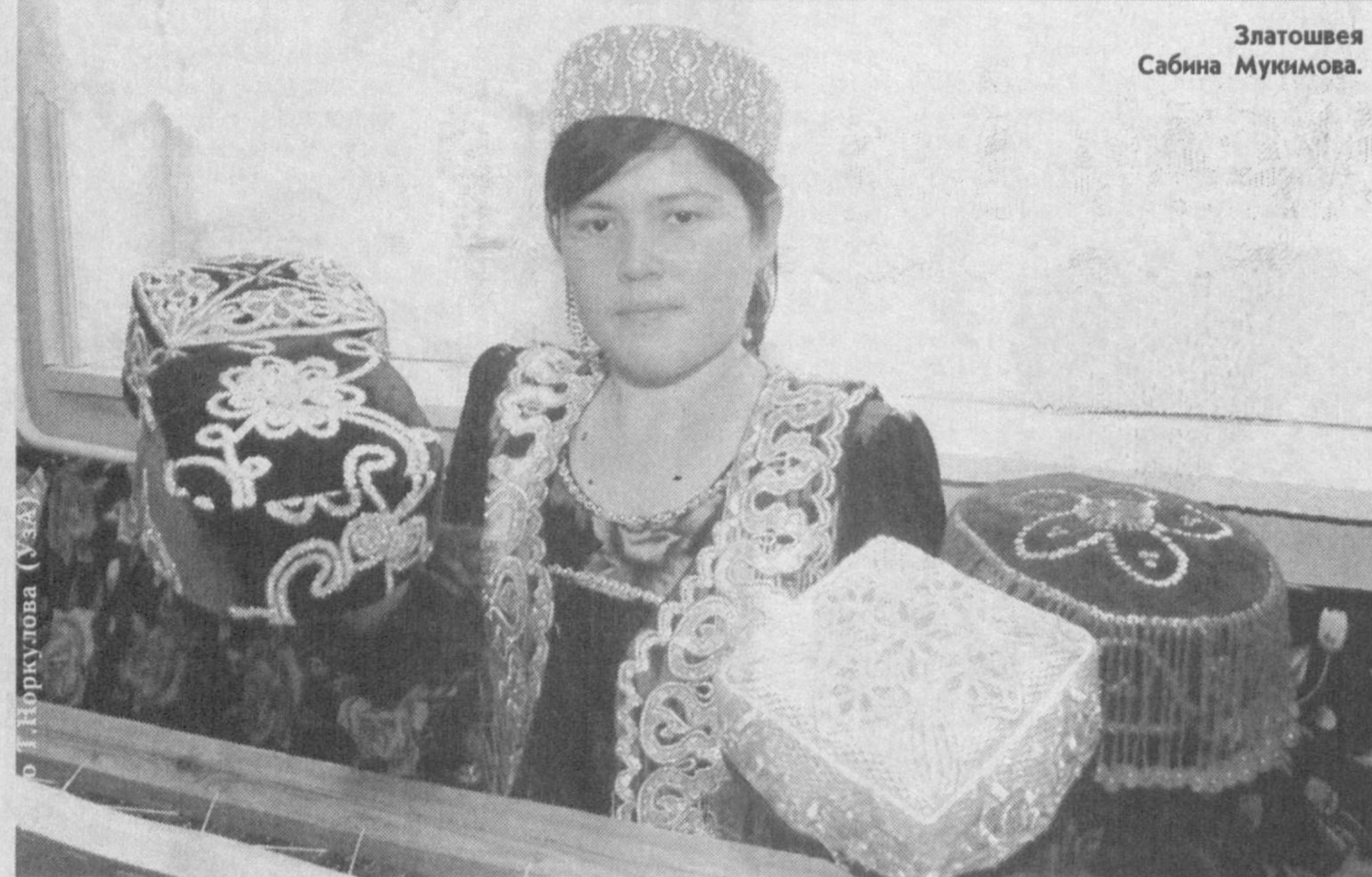
В Ургутском профессиональном колледже строительства и национального ремесленничества по 11 направлениям обучаются 1350 учащихся. Занятия здесь проходят в учебных классах, оснащенных ремесленным оборудованием. Учащиеся колледжа овладевают секретами златошвейного дела и национальных ремесел.

Предстоящий официальный визит Президента Республики Узбекистан Ислама Каримова в Федеративную Республику Бразилия будет способствовать выводу сотрудничества между двумя странами в политической, торгово-экономической и культурно-гуманитарной областях на качественно новый уровень.