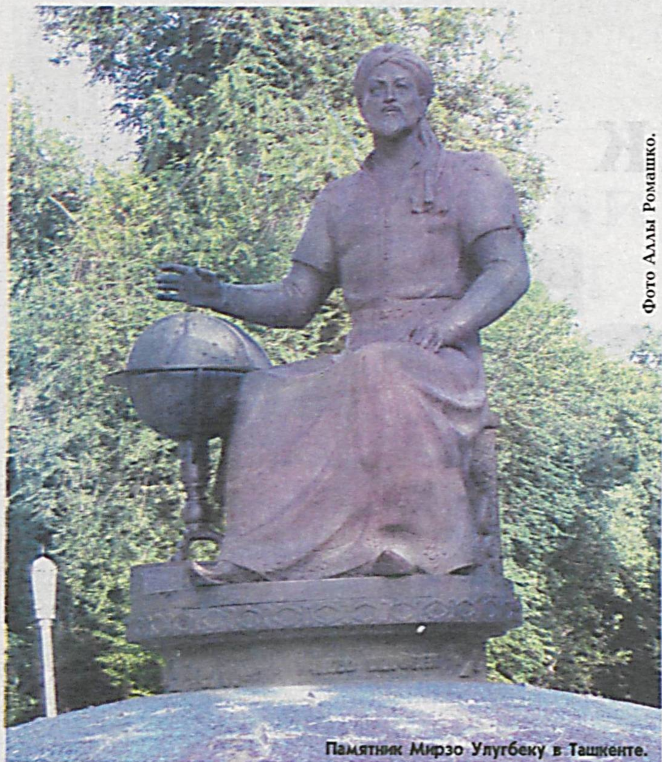
Памятник Мирзо Улугбеку в Ташкенте.