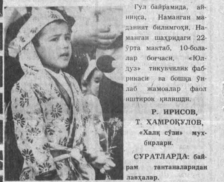
Гул байрамини, айниқса, Наманган маданият билимгоҳи, Наманган шаҳридаги 22-ўрта мактаб, 10-болалар боғчаси, «Юлдуз» тикувчилик фабрикаси ва бошқа гулчилар жамоалар фаол иштирок қилишди.

Наманганликлар учун гулчилик санъатини ривожлантириш одағи айланиб қолган бўлса-да, биз бу йил уни янада бойитдик, — дейди Наманган шаҳар ҳокими Акмал Икромов. — Утган бир ойни тозаллик, озодаллик ойлига, деб эълон қилдик. Бу тадбир бизга азалдан табиатга меҳр, ширинсуханлик, оддийлик, ҳамжиҳатликни тарғиб қилишга хизмат қилиб келади.