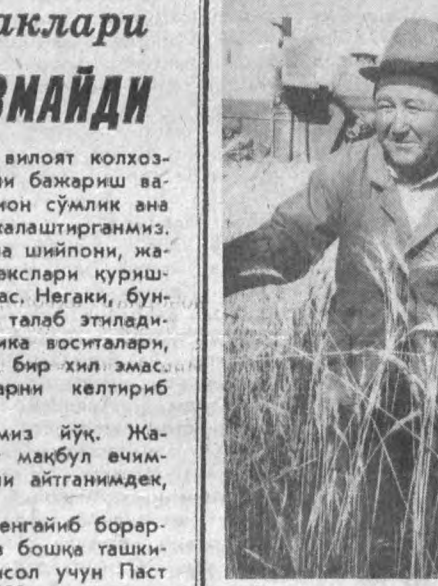
Нуробод туманидаги Кат-тақурғон қоракўлчилик дав-лат хўжалиги ишчилари 12 миң гектар галларзорнинг ҳар гектаридан 6,5 центнер ўр-нига 13,5 центнердан сара дон йиштириб олишаётди.

Ихтиёр ўзингда бўлса, имкониятлар кенгайиб бора-кан. Илгарй бажарадиган барча ишимиз бошқа ташки-лотларга боғлиқ қилиб қўйилганди. Мисол учун Паст Дегром гишт заводидан ҳар йили 500-600 минг дона гишт сотиб олардик. Жуда қимматга турарди.