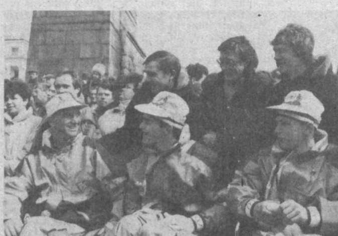
Дорогу осилит сильные духом